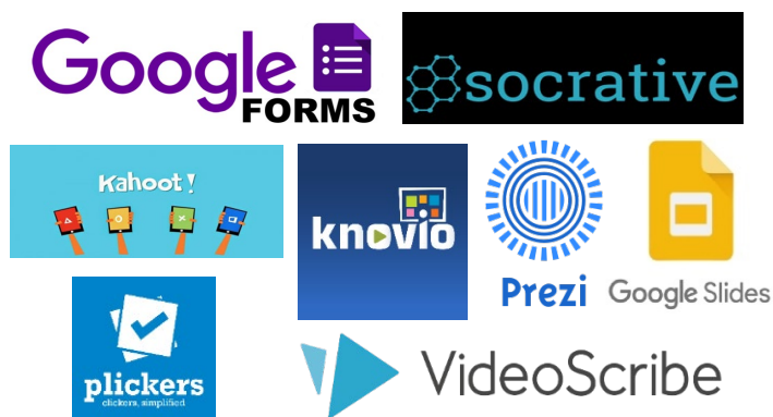
Fig. 5 Herramientas utilizadas por los estudiantes en la materia

En relación a la satisfacción de los estudiantes en relación con la materia y su desarrollo, los diferentes indicadores relativos a innovación, uso de diferentes metodologías, estructuración de los contenidos, recursos didácticos, etc. están por encima de los 8 puntos sobre 10, obteniendo una media de estos indicadores de 8,89 puntos, lo cual refuerza que se trata de una materia que gusta a los estudiantes y que les permite aprender de manera satisfactoria y real (tabla 3).