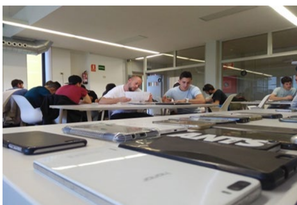
Fig. 2. Sesión de preparación del proyecto por parejas

El trabajo se entrega a través de un tuit en Twitter®, que contendrá el título del trabajo, una imagen adjunta de alguna parte del proyecto y un enlace que redirige a una entrada de un blog creado con este fin.