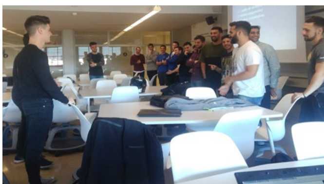
Fig. 3 Presentación dinámica del proyecto en pequeños grupos