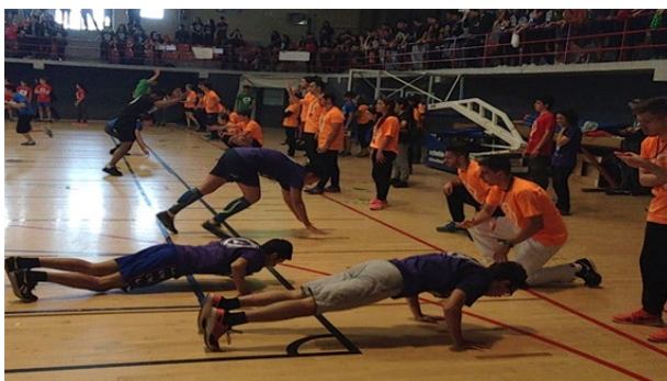
Fig. 4 Proyecto de Educación Física gamificada

Los estudiantes de la materia participan en la organización de la competición e interaccionan con los alumnos y con sus profesores durante su desarrollo.