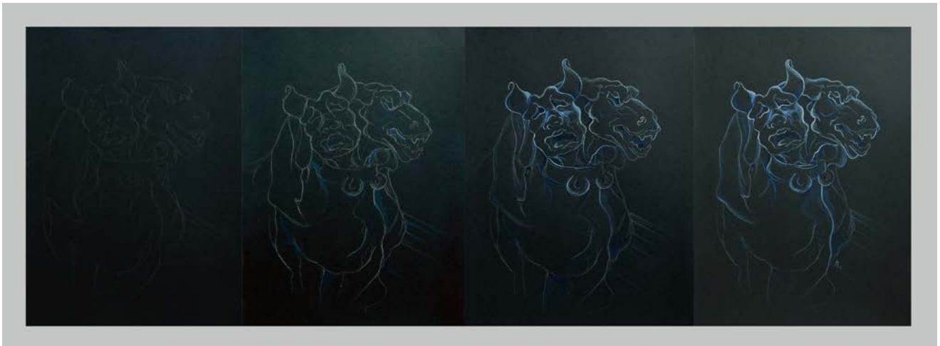
Figura 5. Proceso de los dibujos finales del proyecto La gárgola en la oscuridad , 2019. Gárgola de la catedral de Burgos.

En los dibujos finales comenzamos igualmente con un esbozo a grafito que le aporta una belleza curiosa, ya que no puede observarse si no es dibujando con luz rasante. Conservamos estas primeras líneas en el dibujo final por el gusto de mantener el armazón original visible en el dibujo terminado (algo habitual en el trabajo de la autora). En la figura 5 podemos ver un primer esbozo a grafito, prácticamente imperceptible, que continua con un dibujo a lápiz blanco y lápiz acuarelable azul. Finalmente introducimos el pincel que irá poco a poco dando énfasis a las partes más importantes desdibujando el resto. El resultado final es una gárgola que sale de la oscuridad cruzando el umbral que protege.