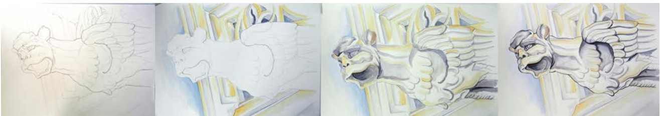
Figura 3. Proceso de las ilustraciones finales del proyecto Una historia de gárgolas , 2014. Gárgola de la catedral de Burgos. Elaboración propia.

Sobre la base de aprendizaje de los bocetos previos se dibuja la gárgola desde el conocimiento y la familiaridad con sus formas. Para darle el entorno primero se construye el fondo arquitectónico que ubica a la gárgola en su contexto catedralicio más habitual; el modelado plástico de las formas sobre la propia gárgola va construyendo una entidad física bidimensional que la separa del fondo; y el remate consiste en darle vida al dibujo con el perfilado final.