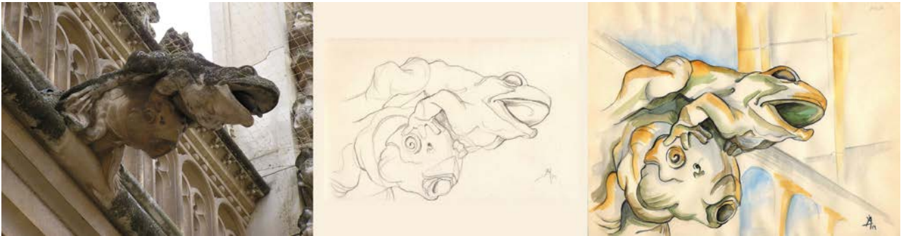
Figura 2. Proceso de selección, bocetos en el block y pruebas de color, 2014. Gárgola del claustro de San Juan de los Reyes, Toledo. Fotografía de la autora (2011) y Elaboración propia.

La selección se manifiesta primero en los bocetos del block de apuntes, que contiene todo el saber gargolesco-visual de la autora. Una vez solucionados los problemas constructivos del dibujo pasamos a las pruebas de color, materiales y acabados. De ahí llevaremos las soluciones constructivas de los bocetos en el block, combinadas con las decisiones de color y modelado de la bidimensionalidad, a un soporte definitivo.