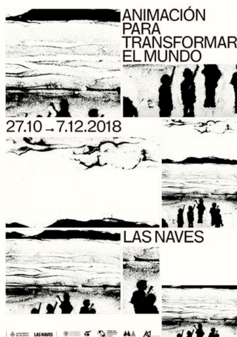
Figura. 2. Cartel de la exposición. Diseño de Iban Ramón

La primera de las acciones del proyecto fue la exposición "Animación para transformar el mundo", con la finalidad de mostrar a través de la selección de dos autores y dos autoras preocupados por lo social y comunitario desde la animación de autor comprometida, este tipo de arte y su vínculo con la realidad social y personal de ciertos colectivos representados. Y así visibilizar, difundir, compartir, incluir, unir; asociaciones, usuarios y otros actores sociales, instituciones, cooperantes y ciudadanos y con ello crear conciencia, viendo a través del tamiz de estas creaciones audiovisuales, las situaciones de otros, reflexionando sobre las mismas, encontrando nuestro lugar en este mundo y la responsabilidad de lo que sucede en el mismo.