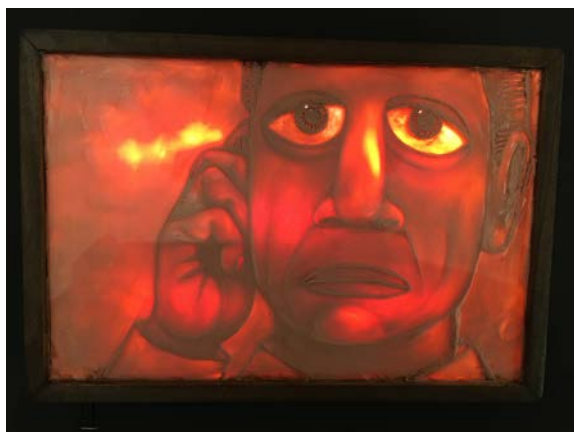
Figura 7. Cuadro retro iluminado con una imagen del filme El ruido del mundo . (2013) Coke Rioboo.