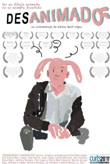
Figura. 10. Cartel de la película Desanimado (2011). Obra reivindicativa al derecho a ser diferente. Emilio Martí