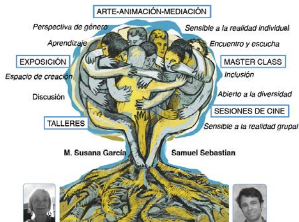
Figura 1 Elaboración propia. Imagen representativa del proyecto.

El arte actúa como una vía de expresión que permite al individuo conectar con sus propias dificultades y capacidades y así expresarlas para si mismo o para otros de manera metafórica en sus creaciones. La expresión de ese universo propio a través de las producciones artísticas es un recorrido a través de contenidos subconscientes que se hacen visibles más fácilmente mediante la representación artística, constituyéndose así en un elemento de mediación hacia el individuo y el grupo con lo social, ya que pone en valor su capacidad de re-creación. (Moreno, 2016). 1