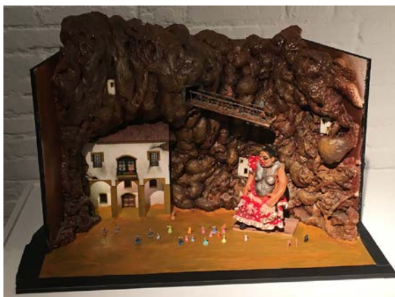
Figura 6. Escenario y personajes a diferente escala de la película Mad in Xpain (2018) Coke Rioboo