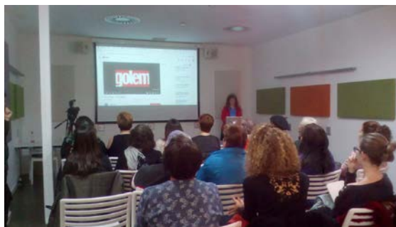
Figura 9. Foto de la Masterclass. Sala Factoria. Las Naves.