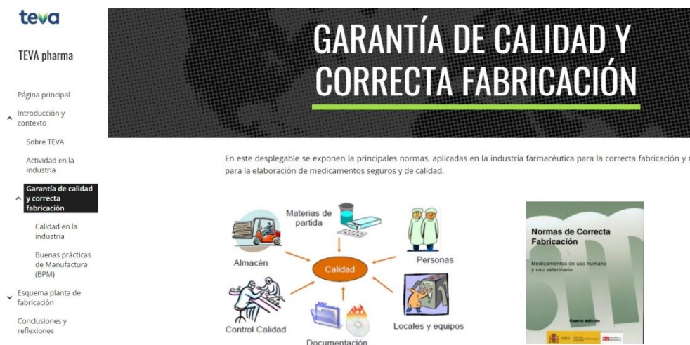
Fig. 2 Diseño de una de las web creadas por los alumnos

Otros resultados son las propias páginas creadas por los alumno. Contienen toda la información recogida y su diseño y creación ha sido desarrollada por cada grupo. Este material es el que se emplea para la doble evaluación: la primera es la evaluación de los alumnos a sus compañeros, ya que la página es una wiki en la que todos (incluidos los docentes) pueden modificar sus contenidos, y la posterior evaluación de los docentes mediante el uso de una rúbrica. Se muestra un ejemplo de una web diseñada por los alumnos en la Figura 2.-