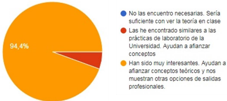
Fig. 3 Resultados valoración de los alumnos sobre el proyecto

Otros resultados a preguntas se muestran a continuación: