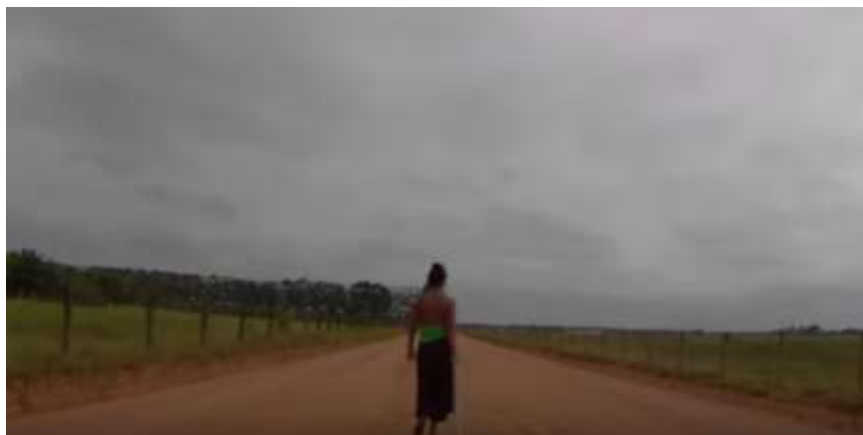
Fig 9 Videoperformance Camino Ancestral