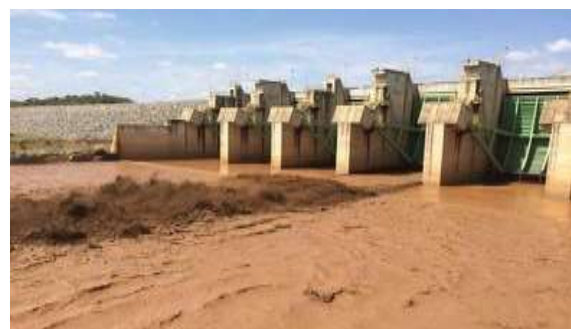
Fig. 5 Usina de Baguari - Después