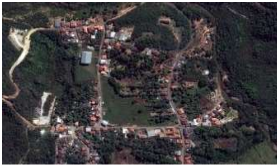
Fig.3 Bento Rodrigues Antes