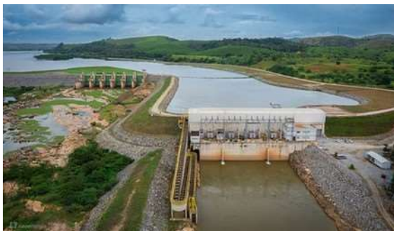
Fig. 5 Usina de Baguari - Antes

Es un polo económico del Vale do rio Doce, se sitúa a orillas del Rio Doce. Conocido como "Princesinha do Vale" (Princesita del Valle) y "Capital do Vale do Rio Doce" (Capital del Valle de río Doce), por ser la ciudad principal bañada por este río, siendo este uno de sus principales atractivos turísticos. Una de las regiones más afectadas con el desastre, que dejó sus 278mil habitantes sin agua después que el lodo toxico llegó al Río Doce, que afecto la Usina de Baguari, principal responsable por el suministro de agua de la región.