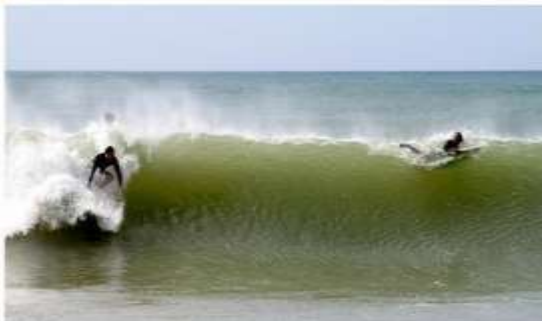
Fig. 1 Antes