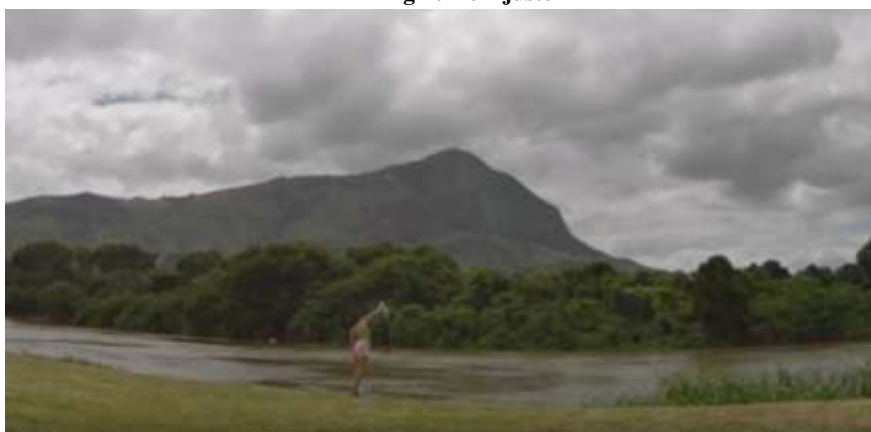
Fig 10 Re-Ajuste