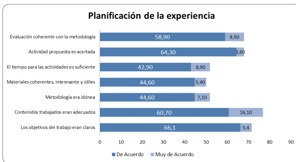
Figura 1. Resultados sobre la planificación de la experiencia.

Por otra parte, si sumamos la parte de acuerdo (3- de acuerdo y 4- muy de acuerdo) podemos constatar que algunos ítems alcanzan porcentajes considerables (Figura 1).