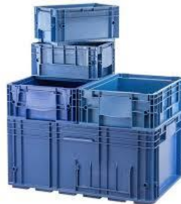
Ilustración 3: KLT