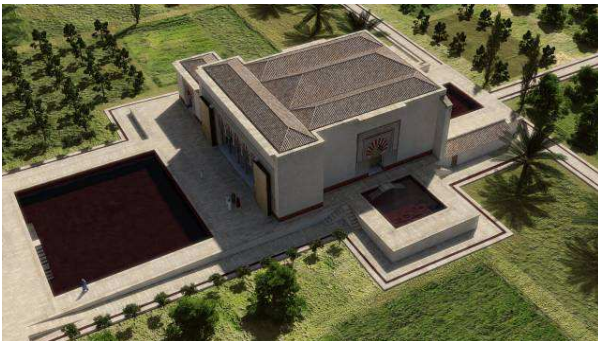
Fig. 3. Pabellón Central y Jardín Alto

Sin embargo, el estudio del Pabellón (fig. 3) caminaba en un nivel inferior puesto que compartía con la mezquita aljama un intenso grado de expolio que tan solo había respetado restos muy puntuales del edificio. Este factor, aunque dificultaba la investigación, en modo alguno la había imposibilitado puesto que, al igual que el Salón, estaba recubierto por un placado decorativo en piedra cuyo estudio sistemático hizo posible recomponer gran parte de su exorno. Esta labor permite identificar los distintos elementos arquitectónicos que componían la estructura y, por tanto, sentar unas bases sólidas y fundamentadas para su levantamiento tridimensional.