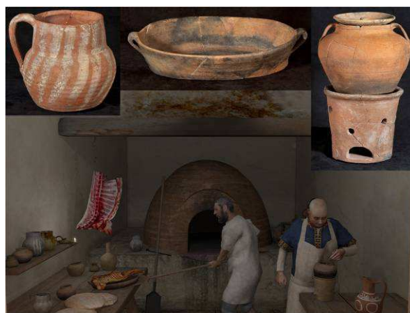
Fig. 8. Cocina de la Vivienda Oriental de Servicio y vajilla cerámica original

Un complemento imprescindible de la vida en la medina es, sin lugar a dudas, la cerámica. El ajuar cerámico representado es transportado por gran parte de los personajes relacionados, especialmente, con el ámbito más doméstico del alcázar, aunque también aparecen en estancias reservadas al servicio de importantes personajes. Así, en la recreación tanto de los espacios de tránsito, como pueden ser las calles, como de las habitaciones que contienen una marcada funcionalidad de servicio, la inclusión de estos elementos complementa a los personajes y permite una mejor percepción de los mismos (fig. 8).