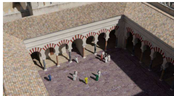
Fig. 5. Mezquita aljama. Patio

- el diferente acabado de los pavimentos que oscilan de la rugosidad del ladrillo cocido que encontramos en el Salón Basilical Superior hasta el brillo que acompaña a los pavimentos de mármol y que permite el reflejo de los elementos arquitectónicos que lo rodean, como en el gran Salón de recepciones. A este respecto, también deben resaltarse los pavimentos del patio de la mezquita aljama (fig. 5) y los que forman parte de los Edificios Superiores. En ellos cobra especial relevancia no sólo el tratamiento que se hace de sus superficies, representadas por la caliza violácea, en un caso, y la calcarenita, en el otro, sino muy especialmente por la disposición que presentan, con idéntico despiece al que muestran estas estancias y que aún hoy puede apreciarse con claridad.