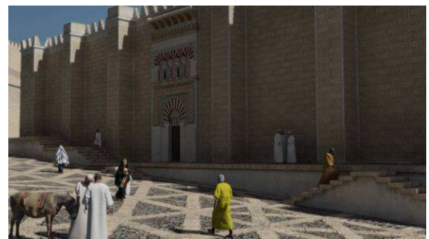
Fig. 2. Levantamiento de la mezquita aljama

Su reconstrucción exigió una profunda investigación de los restos conservados que permitió la clarificación de los distintos elementos que componían su estructura, junto a la ubicación y disposición de su decoración. A este respecto, el levantamiento del alminar conllevó la labor más exhaustiva puesto que fue necesario precisar su configuración, sus dimensiones, su decoración arquitectónica y la definición del tipo de almenas utilizadas. Lógicamente, esta investigación estaba ya avanzada, sin embargo, la elaboración del audiovisual obligó a centrar la atención en todos los elementos que componían el edificio, desde los más aparentes a los menos visibles.