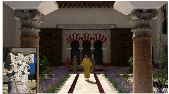
Fig. 4. Vivienda de la Alberca. Reconstrucción e imagen actual de uno de sus capiteles

acondicionamiento de los espacios y para permitir al espectador una mejor introducción en los diferentes ambientes. Este aspecto resultaba especialmente interesante, sobre todo, si tenemos en cuenta que el audiovisual recrea la vida en el sector palaciego de la ciudad, circunstancia que proporcionaba una ocasión única para trabajar con una compleja multiplicidad de elementos. En este sentido, merece especial atención el tratamiento de las estructuras arquitectónicas, en las que se plasma toda una variedad de texturas que incluyen: