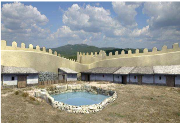
Figura 1. Reconstrucción virtual de la zona oriental del poblado prerromano, en torno a la cisterna rupestre.

Los trabajos de excavación sistemáticas, iniciados en 1995, han permitido documentar un destacado asentamiento con una ocupación continua a lo largo del primer milenio a.C. -entre el siglo VII y la segunda mitad del I a.C.- (Almagro-Gorbea et al. 1996; Moneo 2001; Lorrio 2001 y 2007), para abandonarse en época romana, reocupándose de nuevo durante la Alta Edad Media (siglos VIII-X d.C.) (Lorrio y Sánchez de Prado 2004b, 2007 y e.p.).