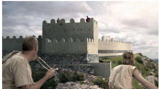
Figura 5. Reconstrucción virtual de un ataque a El Molón en el contexto de las guerras del siglo I a.C.

Dentro de la secuencia histórico-arqueológica del yacimiento, hemos generado un cambio de ritmo con una digresión dramatizada, ha modo de ventana al pasado: un corto de tres minutos en el que se reproduce un posible hecho o acontecimiento con el fin de que el observador cambie su registro y se convierta durante breves momentos en público (Figura 5).