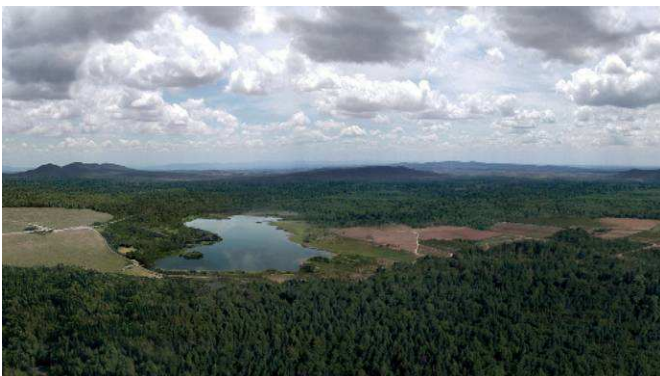
Figura 4. Reconstrucción virtual del entorno de El Molón en la Prehistoria.

La línea expositiva de este producto estaría entorno a la metodología de los proyectos ARQUEOMEDIAS, es decir, las recreaciones positivistas de hechos, elementos y objetos arqueológicos con la máxima fidelidad con métodos Multimedia.