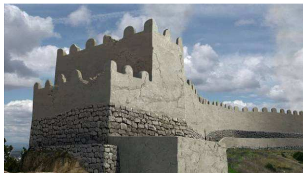
Parque Temático Arqueológico de El Molón

como tal. Para tal fin, queriendo aunar la investigación científica, la didáctica sobre el patrimonio y la divulgación, se han utilizado algunas de las herramientas más modernas como la digitalización de materiales y de estructuras, la reconstrucción virtual de los elementos documentados y, finalmente, la visualización como documental de yacimiento de El Molón, incorporando todos los elementos y recursos reunidos.