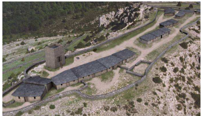
Figura 2. Reconstrucción virtual del poblado islámico desde el Sur.