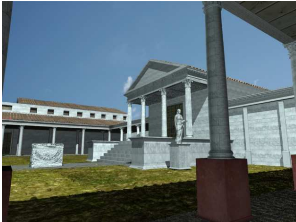
Figura 6. Vista desde el pórtico simple de la Aedes . Al fondo la basílica y el porticus simplex

El siguiente espacio lo conformaba la aedes . Ubicada en el lado oeste, se enmarcaba presidiendo en eje axial todo el conjunto público monumental. Dicha aedes se configura como tetrástila sine posticum , con unas dimensiones vitrubianas de 1:2, es decir el largo es el doble de ancho. Se elevaba sobre un pódium con una altura aproximada de 1,80 metros. Durante su excavación se constató su planta íntegra, así como su técnica edilicia y parte del caementum que servía de alma a las escalinatas de acceso, que dejaba entrever un total de unos 7 u ocho escalones (Fig. 9).