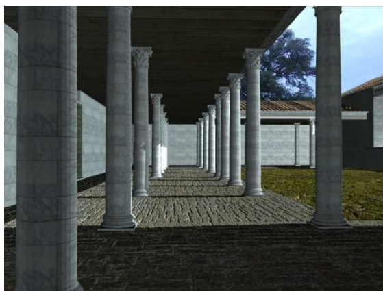
Figura 2. Vista del Porticus duplex

Son numerosos los espacios que se encuentran en este foro. Desde el sur, y comenzando con la primera de estas estancias, destaca un porticus dúplex . Este espacio conforma el lado norte del recinto. Este porticado está sustentando por un total de 28 columnas y por su disposición parece corresponderse con un espacio basilical (Fig. 2).