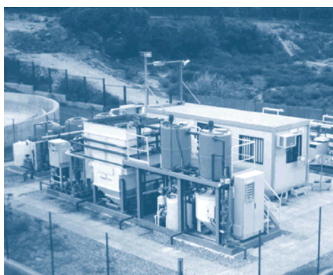
Figura 1. Vista general de la instalación.