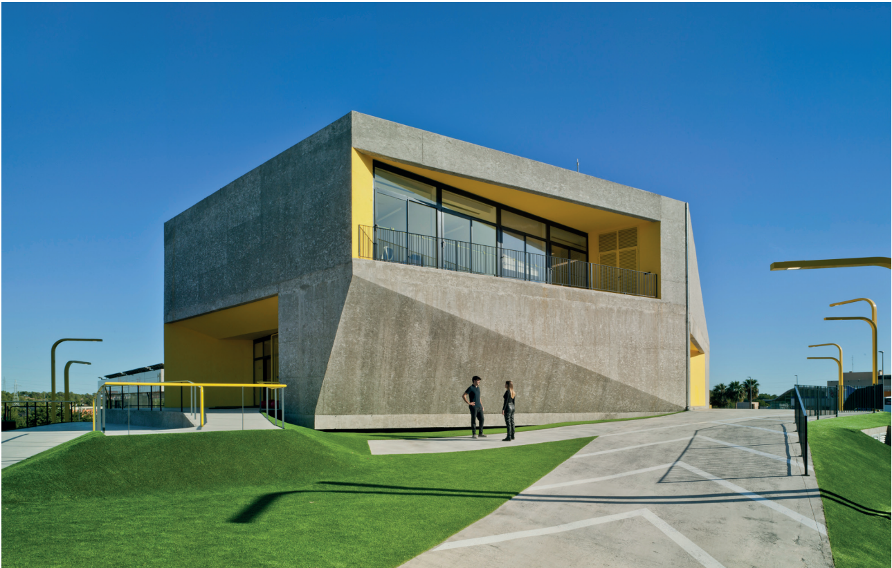
Figure 2. North and West Facades. / Figura 2. Fachadas Norte y Oeste.

into a multipurpose stand, axis generating our proposal, which framed the sky and runs towards the main terrace, and downtown leisure space (fig. 2).