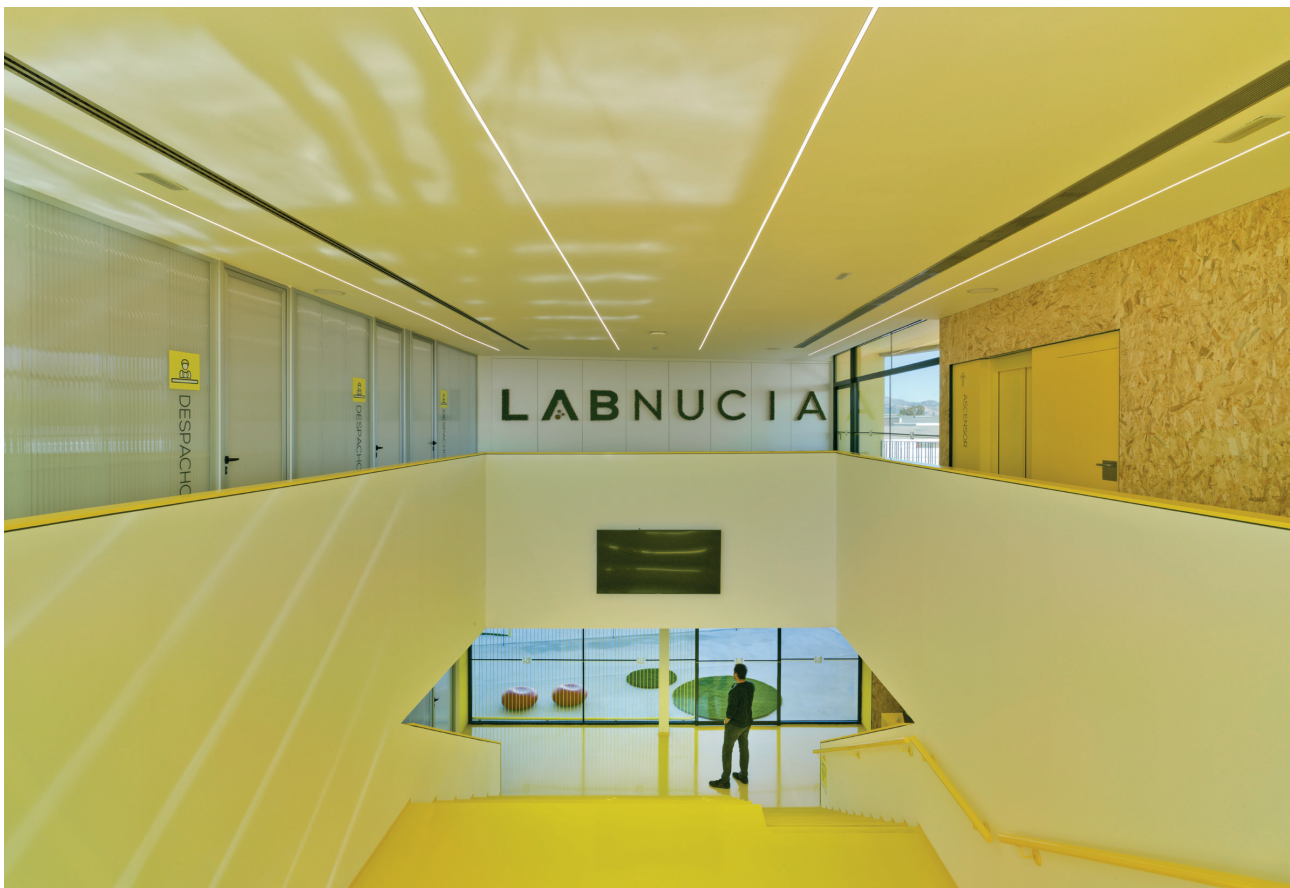
Figure 4. Centra space. Crystalzoo Archive (2019). ©David Frutos / Figura 4. Espacio central. Archivo Crystalzoo (2019). ©David Frutos.

architecture of the business fabric, an iconic and attractive and at the same time a solid and functional space, that was able to empathise with the dreams and ideas of its users. Our building is the cover letter of these entrepreneurs, so we try to transmit a set of ideals that were common to all through architecture (fig. 3).