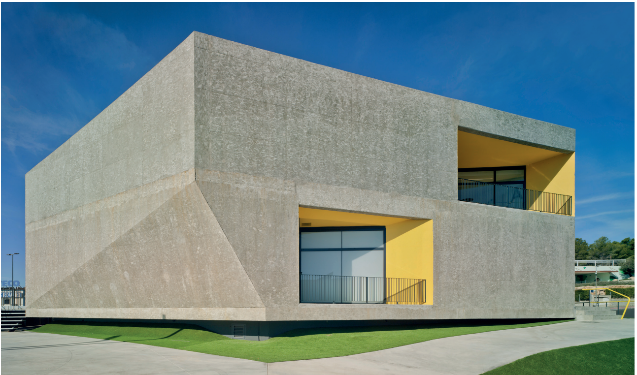
Figure 8. East Facade. Crystalzoo Archive (2019). ©David Frutos / Figura 8. Fachada Este. Archivo Crystalzoo (2019). ©David Frutos.