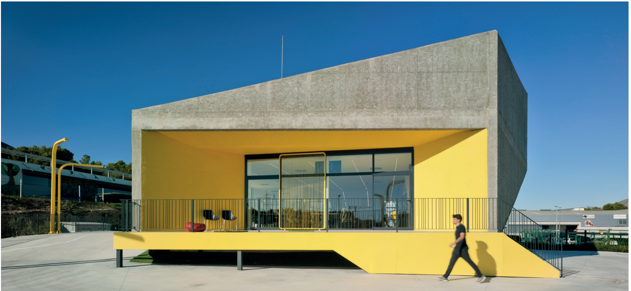
Figure 7. South Facade. / Figura 7. Fachada Sur.