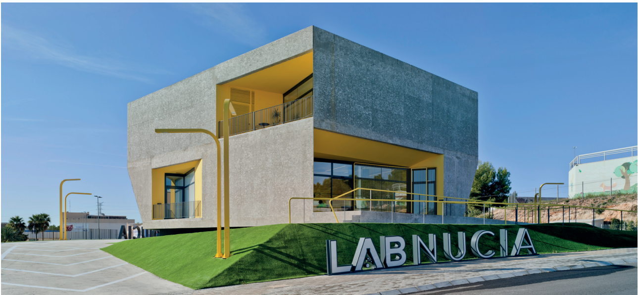
Figure 1. North and East Facade. Crystalzoo Archive (2019). ©David Frutos / Figura 1. Fachada Norte y Este. Archivo Crystalzoo (2019). ©David Frutos.