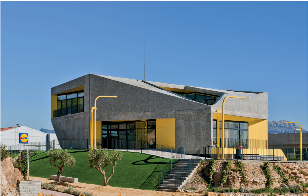
Figure 3. South and West facade and East facade. Crystalzoo Archive (2019). ©David Frutos / Figura 3. Fachada Oeste y Sur. fachada Este. Archivo Crystalzoo (2019). ©David Frutos.

the football stadium that was in the drafting phase at the moment in the office and that polluted the approaches of this project. In La Casilla Social Centre , we managed to expand an old road workers house through the dislocation of its walls, generating a new building in which the two architectures cohabit, in a continuous dialogue between the vernacular and the contemplation.