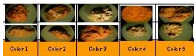
Figura 2. Agregados del suelo con diferentes colores

La vegetación , condiciona los intercambios gaseosos con la atmósfera circundante. Y además condiciona la humedad del suelo favorecida por la cubierta vegetal que protege de la evaporación y de los contrastes térmicos