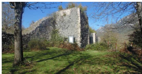
Fig. 1. Serino, Civita di Ogliara, recinto fortificato, epoca longobarda.

tra VII e IX secolo, come attestano le tipologie murarie e gli stessi ritrovamenti ceramici del tipo a bande rosse, del recinto fortificato della Civita di Ogliara (Peduto, 2007, pp. 415, 430-431, 434), nel territorio di Serino, a poca distanza dalle sorgenti del fiume Sabato. Il sito sorge lungo la fascia pedemontana del Monte Terminio e si presenta come una fortificazione costituita da mura lunghe circa due chilometri, con una forma irregolare che segue l'andamento del promontorio.