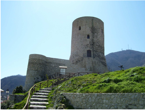
Fig. 4. Summonte, castello, epoca angioina.

Numerose sono in Irpinia le presenze di impianti fortificati angioini: una piccola torre angioina isolata di 4 metri di diametro e di circa 10,50 metri di altezza è ben visibile in altezza a Marzano di Nola (Coppola, Muollo, 2017, pp. 226-227); un'altra torre cilindrica svetta all'interno del complesso archeologico del Castello del Monte di Montella (Rotili, Pratillo, 2010) e insieme a un palatium è circondata da un'imponente cinta difensiva; a Rocca San Felice (Rotili, 1991-1992b), situata in un luogo strategico su uno sperone roccioso al limite orientale del ducato beneventano, è presente il donjon cilindrico alto circa 10 metri edificato su precedenti preesistenze, longobarde e normanne. Degno di rilievo è anche il torrione circolare del castello di Avella su base leggermente scarpata, articolato su cinque livelli 2 e la fortificazione di Ariano Irpino, che dopo la battaglia di Benevento e a seguito dei danni subiti nel 1255 dalla ferocce aggressione delle truppe di Manfredi, fu interamente ricostruita in epoca angioina (Coppola, 2012, pp. 90-117, in particolare pp. 109-110). Dello stesso periodo sono poi le cortine murarie del lato Est del castello di Avellino (Barra, 2013, pp. 40-41), attualmente schermato dal muro realizzato dall'intervento dei Caracciolo e una grande torre cilindrica sul lato settentrionale.