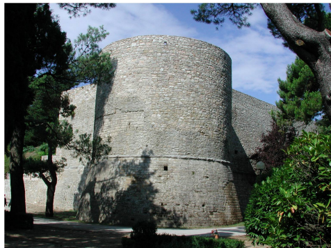
Fig. 5. Ariano Irpino, castello, epoca aragonese.

Gesualdo, Grottaminarda, Grottolella, Manocalzati, Melito Irpino, Montefalcione, Montemiletto, Monteverde, Sant'Andrea di Conza, Taurasi, Torella dei Lombardi, Tufo e Zungoli.