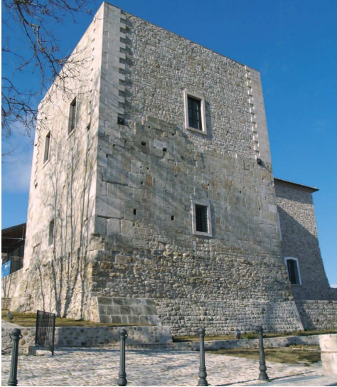
Fig. 2. Sant'Angelo dei Lombardi, donjon , epoca normanna.

due o tre piani divisi in ciascun piano con due grandi ambienti attraverso un muro mediano ( mur de refend ). Sul muro di spina centrale prendevano appoggio i solai, sorretti spesso da volte a botte o a crociera.