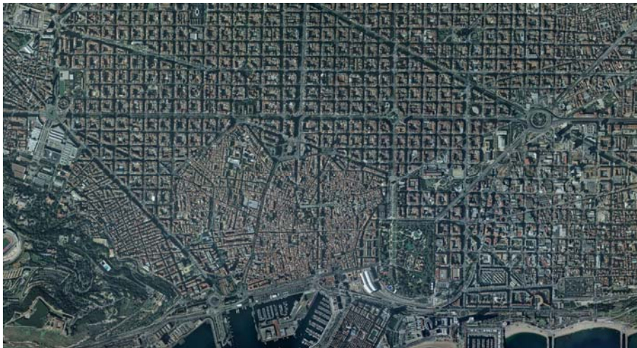
Fig.1. Ensanche de Barcelona (Fuente: Institut Cartogràfic de Catalunya).

La práctica urbanística bajo la óptica administrativa ha ido reduciendo su valor propositivo al de simple gestor, subordinado al cumplimiento de un marco legal poco flexible, en la mayoría de las ocasiones obsoleto respecto a las demandas que plantean los nuevos modelos sociales. La iniciativa pública en la formulación de planteamientos urbanos innovadores se restringe a recomendaciones de carácter formal, excepcionalmente estructurales. Por otro lado el sector privado da muestras de haber renunciado definitivamente a la filantropía a favor del rendimiento cuantitativo.