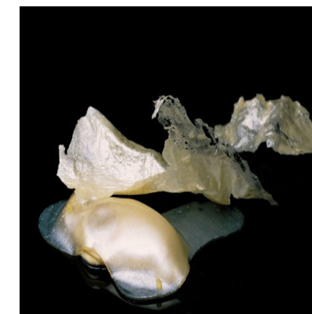
Figura 04: Ostras inspiradas en el Guggenheim de Bilbao por el chef Quique Dacosta. https://gastronomiaviva.republica.com/2015/08/25/ostra-homenaje-a-frank-o-gehryguggenheim-de-qui-que-dacosta/

Dirección: Partida Colina del Sol 49 A, 03710, Calpe [Alicante] Intervención arquitectónica: Nueva obra Situación: Costa Chef: Ferdinando Bernardi Cocina: Italiana contemporánea