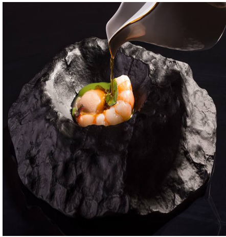
Figura 03: Tapa de Audrey's de Rafa Soler. https://tapasmagazine.es/local/audreys-by-rafa-soler/