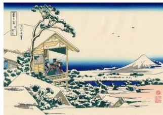
Hokusai, K., Casa de Té en Koishikawa. La mañana después de una Nevada (hacia 1830) 9

La Directiva también atiende a la situación de los empresarios de buena fe insolventes o sobreendeudados, que podrán gozar de la total exoneración de deudas, acogidos pues a una “ segunda oportunidad ”. Tras la tormenta, siempre que su conducta haya respetado las reglas de la buena fe, podrán ver sus deudas exoneradas y podrán “recomenzar” “desde cero”, “en limpio”, “sobre blanco” y sin el lastre de sus deudas anteriores.