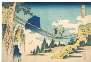
Hokusai, Puente colgante (1830) 5 .

La imagen de Hokusai de unas personas cruzando el puente colgante es muy expresiva de la realidad actual ante estos procedimientos todavía vigentes. En total contraste, la Directiva comunitaria de 2019 diseña un marco preventivo para la reestructuración financiera cuando la insolvencia sea inminente, para garantizar la viabilidad del deudor y establece una serie de medidas que aumentarán en todos los Estados miembros la eficiencia de los procedimientos de reestructuración, insolvencia y exoneración de deudas.