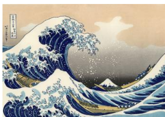
Hokusai, La gran ola de Kanagawa (1830) 1