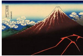
Hokusai, Tormenta debajo de la cumbre (1830) 6

En lugar de que el camino sea el seguido hasta ahora, en que la insolvencia lleva a la liquidación de la empresa, se abre una nueva vía: se tiende a favorecer planteamientos que tengan por objeto la recuperación de la empresa o de sus unidades económicamente viables. Tan pronto como se observen signos de alarma o de alerta deberán ponerse en marcha los mecanismos preventivos previstos para evitar la insolvencia y el concurso.