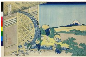
Hokusai, Rueda Hidráulica (1830) 7

La reestructuración permitirá a los deudores en dificultades financieras continuar con su actividad empresarial, en su totalidad o en parte, modificando la composición, las condiciones o la estructura del activo y del pasivo o de cualquier otra parte de su estructura de capital, por ejemplo, en su caso mediante la venta de activos o de parte de la empresa.