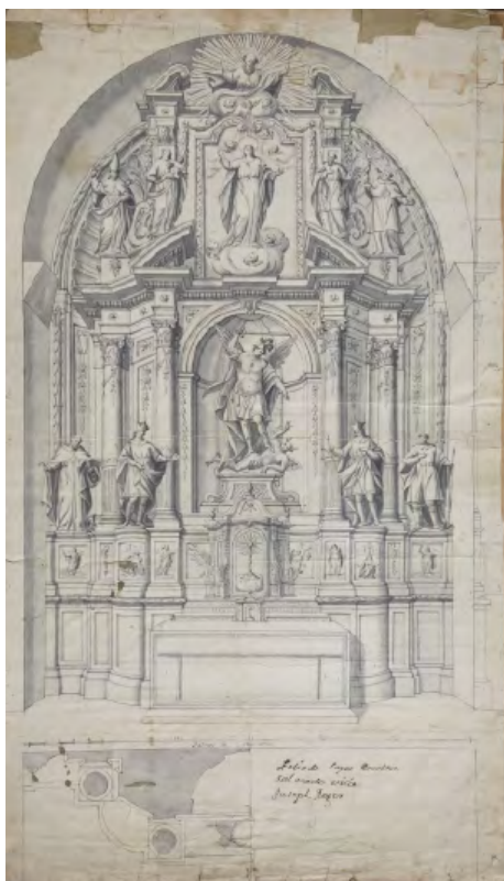
Fig. 3. Félix de Sayas, Retablo de San Miguel, sin fecha, Gabinete de Dibujos y Grabados del Museu Nacional d'Art de Catalunya.

En el MNAC de Barcelona se conserva un dibujo de Félix de Sayas con la traza de un retablo dedicado a San Miguel, firmado por el artista y los representantes de la parroquia que posiblemente lo contrataron: FELIX DE SAYAS ESCULTOR / SALVADO VILA / JOSEPH ROGER [fig. 3]. 53 Aunque por dimensiones y advocación pudiera tratarse del retablo de Castelló de Farfanya, los comisionados del pueblo no coinciden con los de Castelló de Farfanya, pues eran Francisco Fontova y Francisco de Berant.