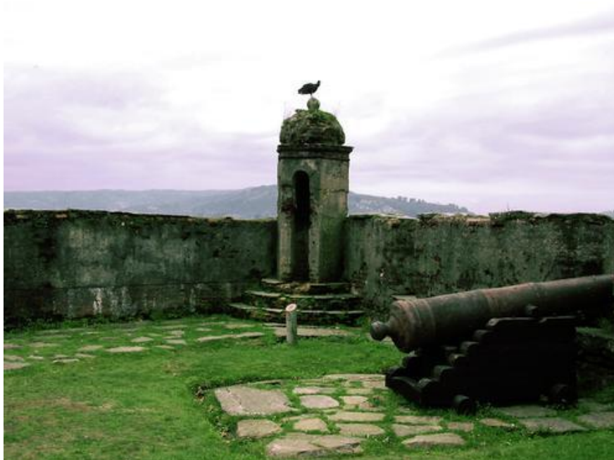
ILUSTRACIÓN 19. Castillo San Sebastián de la Cruz en el municipio de Corral

En cuanto a su situación actual, su estructura mayor esta conservada. Sus baterías se encuentran deterioradas por su situación portuaria y por la harinera de pescado que se encuentra en el lugar, la cual ha generado bastantes deterioros. Además, existe mucha acción irresponsable por parte de los visitantes.