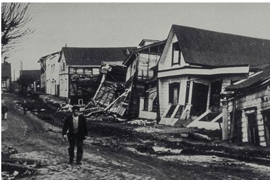
ILUSTRACIÓN 10. Estado en que quedaron las viviendas tras el terremoto, 1960

Décadas después de la recuperación tras el terremoto, quedando devastada totalmente, perdiendo su esplendor y pasando a ser una ciudad como cualquier otra, Valdivia comienza a resurgir poco a poco durante muchos años y más tarde, a presionar al estado para constituirse como una región independiente de las trece regiones que dividían política y administrativamente el país. De esta manera, el expresidente de Chile, Ricardo Lagos Escobar, en su etapa de campaña por el Gobierno, se compromete a la creación de la Nueva Región de Valdivia. En el año 2004 se modifica la constitución de 1980, lo que abre camino a una independencia regional de la zona.