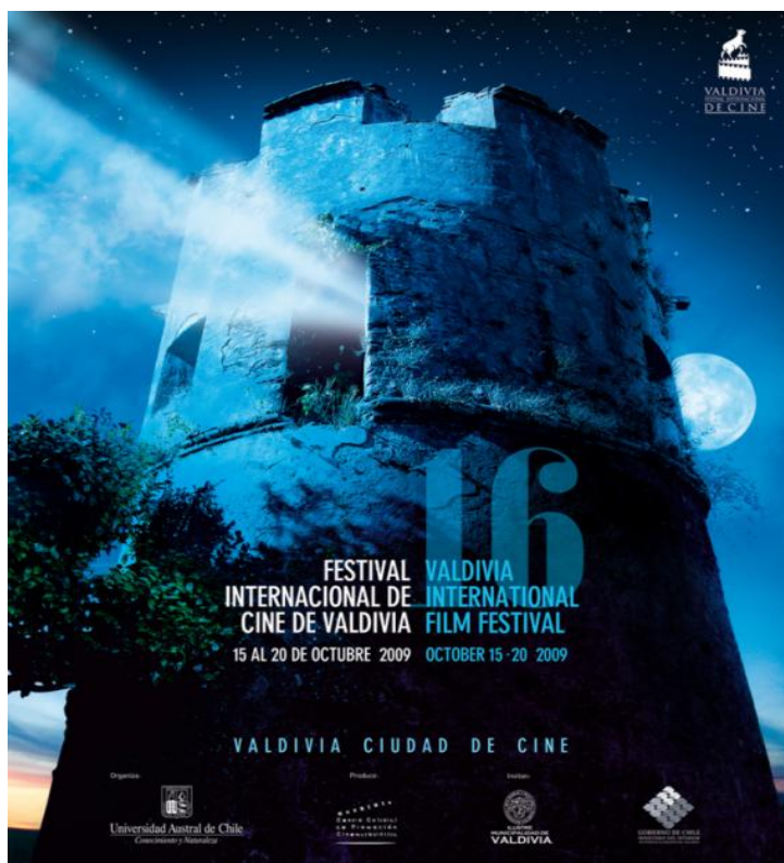
ILUSTRACIÓN 15 Cartel del Festival Internacional de Cine de Valdivia versión n° 16, año 2009