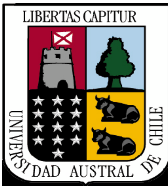
ILUSTRACIÓN 23. Logotipo institucional Universidad Austral de Chile

Se encuentra a cargo de la gestión y administración de los Castillos San Pedro de Alcántara en Isla Mancera, Valdivia y del Castillo San Luis de Alba de Cruces, este último en colaboración con la Ilustre Municipalidad de Mariquina. La misión específica que tiene la Dirección de la Universidad Austral, es la de la conservación y gestión del patrimonio cultural, creando un espacio para la memoria colectiva e identidad local. Las actividades culturales que realiza son una muestra cultural anual en el periodo estival denominada Muestra Cultural Isla Mancera. En ella, inserta las tradicionales celebraciones de la Semana Mancerina con la participación de la comunidad de esta isla. Este programa incluye música en vivo de fusión indígena y celta, folklore urbano, soul y funk, danza y una muestra de cine a cargo de realizadores locales. A su vez, cuenta con ayuda económica de pequeñas entidades locales de corte cultural. Hay que añadir que la Dirección Museológica de la Universidad Austral, aparte de estos dos castillos defensivos, gestiona tres museos más que se encuentran en la ciudad de Valdivia 31 .