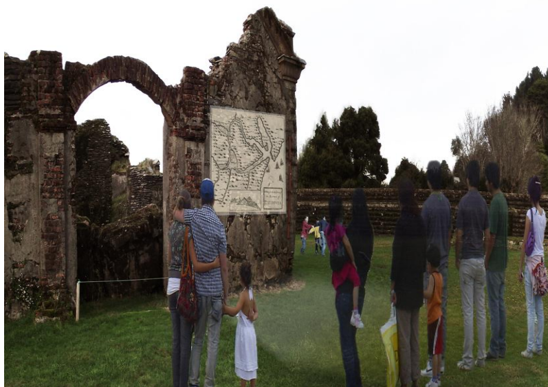
ILUSTRACIÓN 31. Recreación digital de fortificaciones como soporte cultural integrador social del territorio (1)

Un espacio cultural tiene sentido cuando logra ser puente con la comunidad 50 .