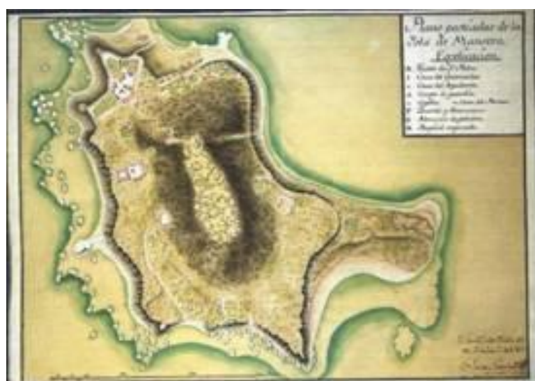
ILUSTRACIÓN 12. Antiguo plano de la Isla Mancera. Servicio Geográfico del Ejército, Madrid