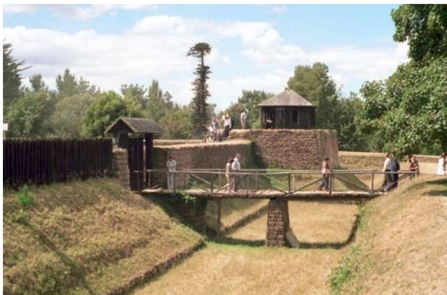
ILUSTRACIÓN 22. Fuerte San Luis de Alba de Cruces