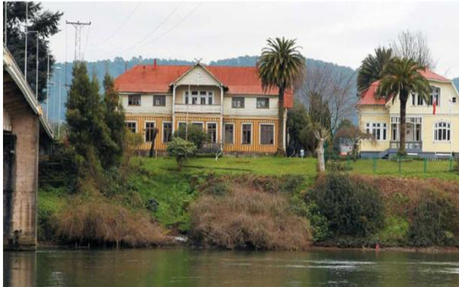
ILUSTRACIÓN 08. Arquitectura colonial alemana en la ciudad de Valdivia. Casa Prochelle declarada monumento en 1985

Años más tarde, en 1960, la ciudad de Valdivia sufre un gran e inesperado golpe de la naturaleza y es azotada por una catástrofe de gran envergadura. El domingo 22 de mayo a las 15:11 horas, gran parte del sur de Chile es sacudido por el terremoto más grande registrado en la historia del mundo, con epicentro en la ciudad de Valdivia, alcanzando los 9.5 grados en la escala de Richter y entre XI y XII en la escala de Mercalli. La ciudad quedó devastada, muchas industrias alemanas y construcciones locales se derrumbaron inmediatamente, mientras el río Calle-Calle, silencioso, inundaba la ciudad 14 .