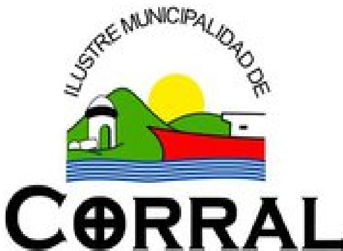
ILUSTRACIÓN 24. Logotipo institucional Municipio de Corral

El municipio estima que su gestión y administración se ajusta perfectamente con el entorno y entrega unas estadísticas que justifican económicamente (ver anexo 22) que sus propuestas son las de una gestión eficiente realizando esta actividad, mencionando nuevamente en su página web: «Corral apostó hace 16 años atrás en la VENTA de productos turísticos y no perdiendo su tiempo en mostrar atractivos turísticos» 32 .