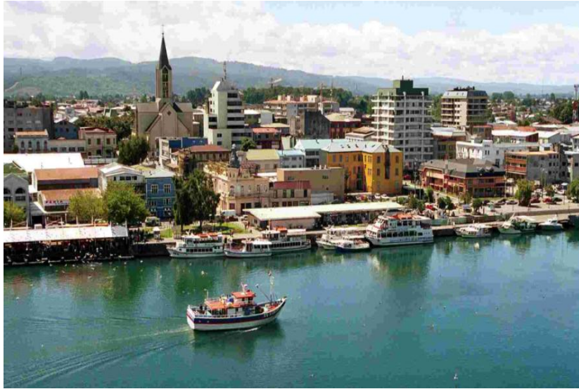
ILUSTRACIÓN 01. Ciudad de Valdivia y su río