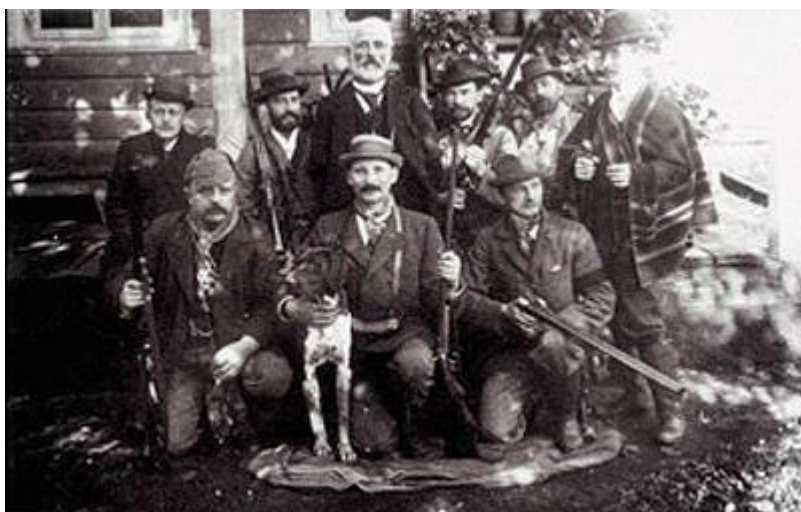
ILUSTRACIÓN 06. Colonos alemanes llegados a Valdivia, en el periodo 1845-1850

Las familias que se instalaron en Valdivia y alrededores eran, casi en su totalidad, provenientes de Alemania.