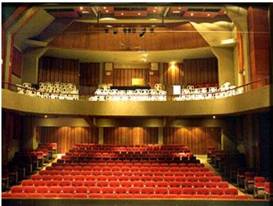
ILUSTRACIÓN 16. Teatro Lord Cochrane de Valdivia