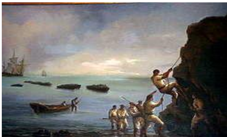
ILUSTRACIÓN 05. La toma de Valdivia, 1821

Tras unas décadas, Chile se consolida cada vez más como un país organizado y estratégico. En consecuencia, en 1845 llegan a Valdivia los primeros colonos, al promulgarse la Ley de Inmigración Selectiva . Esta ley quería conseguir que en la zona se asentaran personas con un nivel sociocultural medio y alto, para colonizar estas regiones y trabajar la tierra de manera productiva para el país.