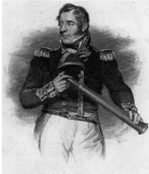
ILUSTRACIÓN 04. Lord Thomas Alexander Cochrane

Lord Cochrane desarrolla dos amplias expediciones previas al Virreinato del Perú con el fin de bloquear el Puerto del Callao e interferir en las líneas de comunicación marítimas en el área, para el desarrollo de su cometido en el sur de Chile.