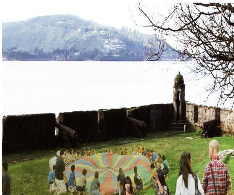
ILUSTRACIÓN 28. Recreación digital de posibles actividades pedagógicas en el Fuerte San Sebastián de la Cruz en Corral

De esta manera, se proporcionará a los seres humanos la capacidad de integrar la cultura, otorgándoles, sobre todo, la libertad en sus procesos de aprendizaje. La pedagogía activa, cultural y/o artística en cualquiera de sus formas y en el caso de la dinamización del patrimonio, debe plantearse como desarrollo del pensamiento creativo y crítico, fortalecer la formación de valores patrimoniales y orientar el proceso de relación de las personas con el patrimonio y con otros individuos.