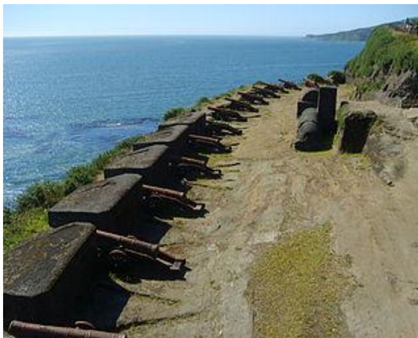
ILUSTRACIÓN 20. Castillo de la Pura y Limpia Concepción de Monfort de Lemus