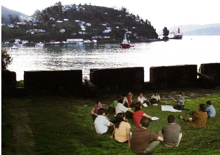
ILUSTRACIÓN 33. Recreación digital de fortificaciones como soporte cultural integrador social del territorio (3)