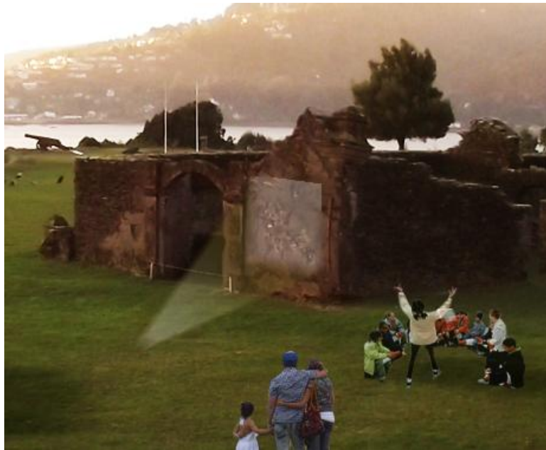
ILUSTRACIÓN 32. Recreación digital de fortificaciones como soporte cultural integrador social del territorio (2)