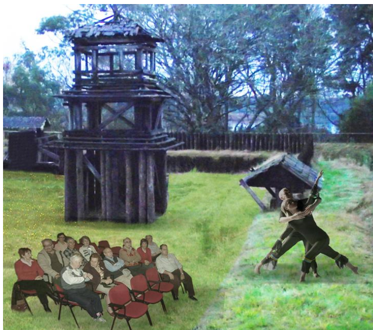
ILUSTRACIÓN 30. Recreación digital de fortificaciones como posible soporte cultural, plataforma de artistas y espacios de desarrollo artístico (2)