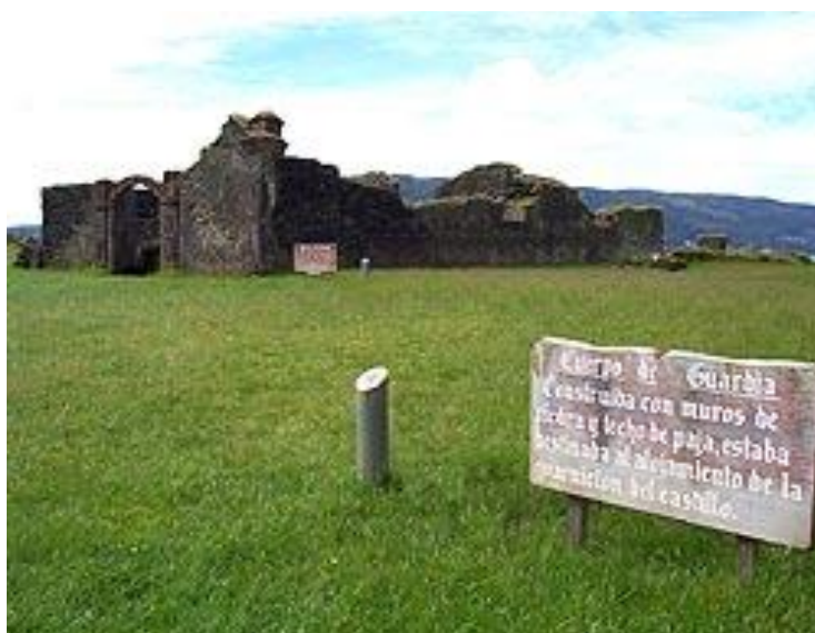
ILUSTRACIÓN 18. Castillo San Pedro de Alcántara en Isla Mancera, Valdivia

Actualmente, su estructura posee un foso, dos torres, ruinas de la antigua Iglesia y de la Casa del Gobernador y un cañón original abandonado en la explanada.