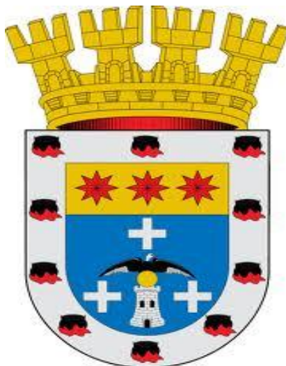
ILUSTRACIÓN 26. Logotipo institucional Municipalidad de San José de Mariquina

No obstante, no es mucho lo que el municipio puede aportar en las acciones concretas en torno a la fortificación debido a la dualidad de administración que existe entre éste, la Universidad Austral de Chile y sus gestiones.