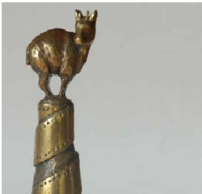
ILUSTRACIÓN 14. Galardón Festival Internacional de cine de Valdivia

Reconocido en Chile como uno de los certámenes audiovisuales de mayor importancia, el Festival de Cine de Valdivia data sus inicios en el año 1994. En sus comienzos, fue gestionado por la Universidad Austral de Chile y actualmente, debido a su consolidación como actividad cultural, el evento se encuentra producido y gestionado por el Centro Cultural de Promoción Cinematográfica de la ciudad, quien recibe apoyo incondicional del Gobierno Regional de Los Ríos, del Consejo Nacional de la Cultura y las Artes, de la Universidad Austral de Chile y del Municipio de Valdivia. El galardón, consiste en entregar a cada producción premiada una estatuilla de un pudú dorado, animal representativo de la Patagonia Chilena 23 .