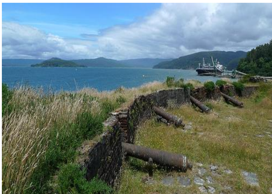
ILUSTRACIÓN 21. Castillo San Luis de Alba de Amargos

Dada esta característica, esta fortificación se encuentra fuera del recorrido turístico. Necesita una reparación de sus murallas con urgencia, la limpieza de la plataforma de la batería del foso de tierra y la reconstrucción de las cureñas.