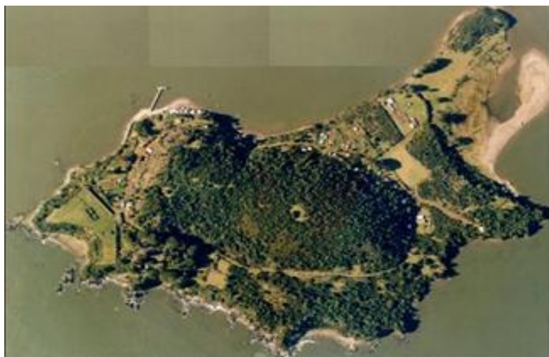
ILUSTRACIÓN 13. Fotografía por satélite de la Isla de Mancera

La decisión necesaria que tomó la Corona Española al proponer iniciativas de asentamiento en la zona del estuario de Valdivia, dio como resultado la necesidad de fortificar puntos estratégicos en todo el estuario, estableciendo así, un dominio absoluto en la costa del Pacífico Sur. El ahínco del Marqués de Mancera, respecto a esta operación, se vio reflejado en la cantidad de indumentaria militar y provisiones que la Armada Española desembarcó en la isla de Mancera.