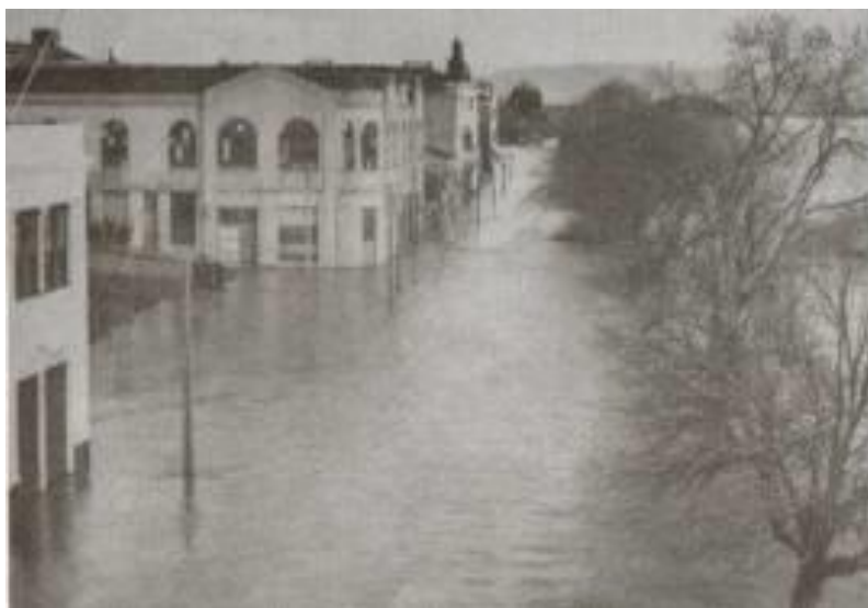
ILUSTRACIÓN 09. Paseo fluvial inundado por desborde del río Calle-Calle

En el estuario del río que alberga las fortificaciones españolas, el nivel del mar subió cerca de los cuatro metros de altura. Una hora aproximadamente bastó, para que una ola de ocho metros de altura arrasara con la bahía. Diez minutos después, el mar, volviendo a retroceder, dejó solo devastación a su paso, para armarse nuevamente y arremeter con una ola aun más grande de diez metros de altura. La onda expansiva del mar, llegó hasta Hawai, Japón e Isla de Pascua.