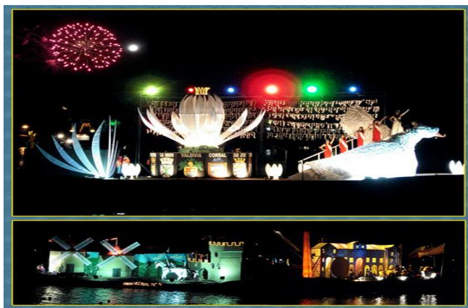
ILUSTRACIÓN 17. Embarcaciones Noche Valdiviana

A su vez, a esta actividad la acompaña cada año la elección de la Reina de los Ríos , cuyas candidatas son sometidas a un estricto jurado, debiendo superar una serie de pruebas intelectuales y de belleza para poder ser coronada como la mejor. No obstante, esta soberana debe cumplir con los valores culturales y las labores sociales que la comprometen durante un año con la ciudad y con sus actividades.