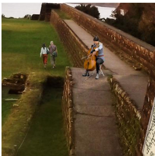
ILUSTRACIÓN 29. Recreación digital de fortificaciones como posible soporte cultural, plataforma de artistas y espacios de desarrollo artístico (1)

Previo a una interpretación como tal y a una integración administrativa que crea en el crecimiento y en la transformación del patrimonio como soporte cultural, estos espacios de integración podrían potenciar de forma ascendente la gestión artística actual de la zona, implementándose en el territorio, no sólo de la fortificación, sino en su entorno, donde los personajes locales aun se encuentran desorientados entre tanta diversidad natural. Es ahí donde se debe potenciar la culturización e interculturización de los espacios en plataformas vivas capaces y abiertas a contrastar la situación actual de las fortificaciones. Es por esto que las administraciones actuales se deben abrir y deben abordar la gestión desde la perspectiva de la integración evolutiva de otras prácticas.