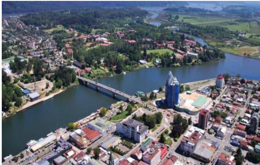
ILUSTRACIÓN 02. Vista aérea de Valdivia

Valdivia fue fundada por don Pedro de Valdivia en el año 1552, aproximadamente cien años antes de la iniciación del complejo defensivo que comenzaría protegiendo la ciudad y el puerto denominado Puerto de Corral en su estuario.