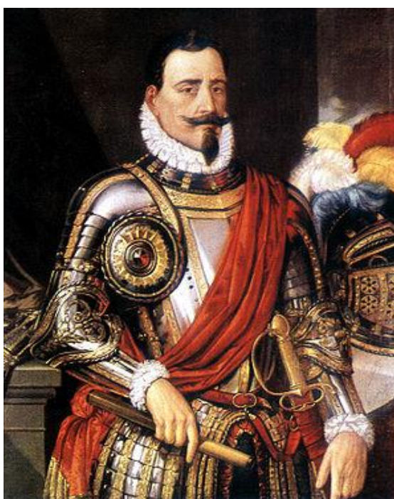
ILUSTRACIÓN 03. Don Pedro de Valdivia, fundador de Santa María la Blanca de Valdivia

La noche del 24 de noviembre de 1599 es conocida como la Noche triste de Valdivia : Un ejército de indígenas con aproximadamente cuatro mil lanzas asaltaron la ciudad, entonces protegida por una simple empalizada. Prendieron fuego a la ciudad y despedazaron las imágenes de las iglesias. Los soldados españoles, sin poder hacer ventajosa su defensa, se entregaron a la violenta embestida.