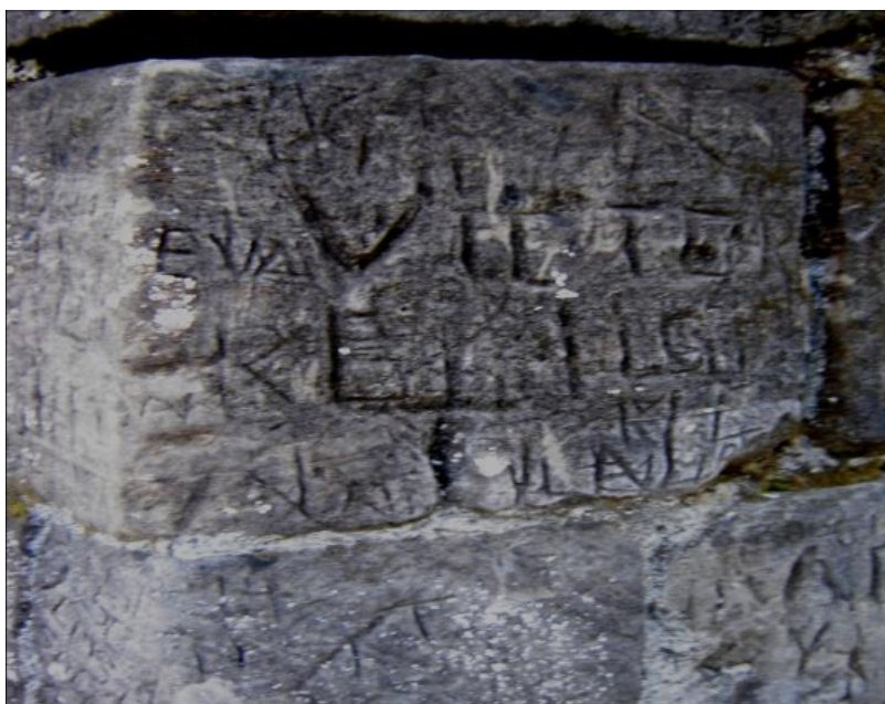
ILUSTRACIÓN 27. Murallas deterioradas por escritura en el Castillo San Pedro de Alcántara

Una de las grandes dificultades que presentan estas administraciones, además de la escasa dinamización, es la seguridad deficiente, lo cual permite el deterioro por actos vandálicos, robo de sus piedras constructivas originales vendidas como artesanía a turistas y el rayado de las mismas por visitantes inescrupulosos.