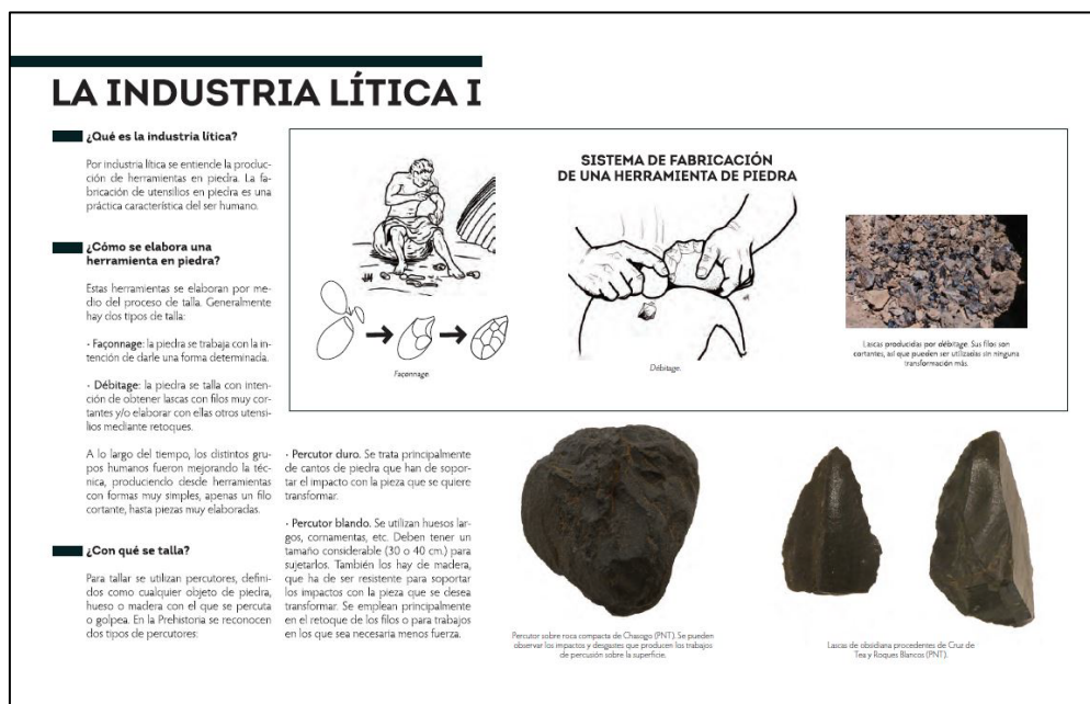
Fig. 1 Imagen de uno de los dossiers de los materiales didácticos

recipientes cerámicos o instrumental lítico. Con este tipo de materiales se abren por tanto alternativas diferentes a la hora de desarrollar la clase, y favorecen la labor del docente, dado que vienen acompañados de dossiers (Fig. 2) con una explicación práctica de los utensilios y materiales que contienen. De este forma el profesorado, que no tiene porqué ser un experto en el tema, puede prepararse las sesiones previamente y contestar a aquellas dudas que surjan durante el desarrollo de la misma.