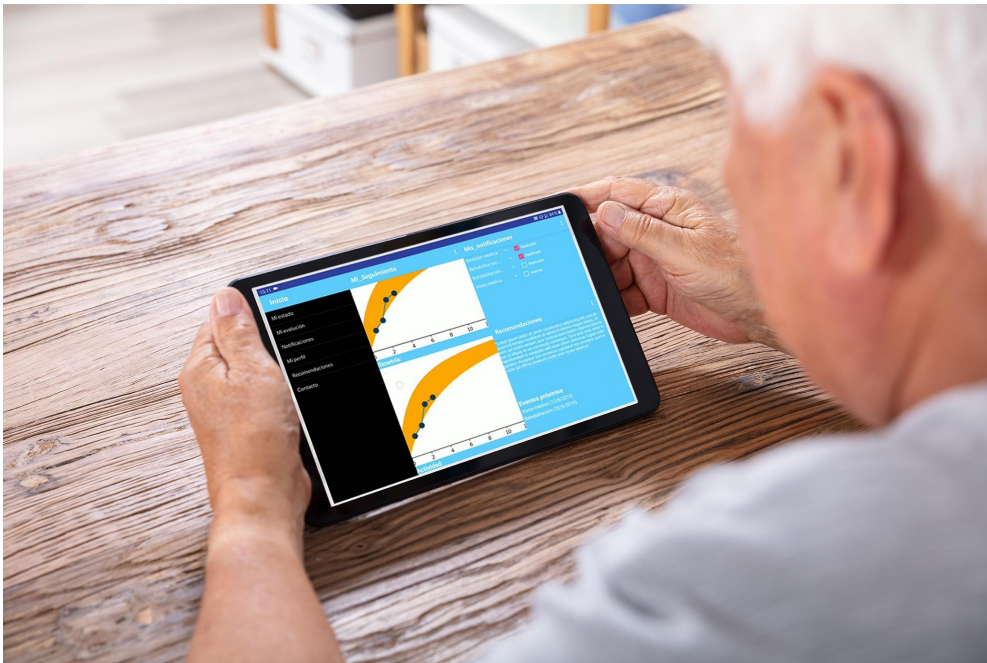
Figura 4. Monitorización de la actividad diaria del paciente mediante tecnologías portables.

La finalización de los estudios clínicos está prevista a finales del año 2020 , momento a partir del cual el servicio estará disponible para empresas fabricantes de producto sanitario y centros hospitalarios . A partir de este momento, está prevista la ampliación de este servicio a otros productos sanitarios como son los implantes de cadera, columna y hombro .