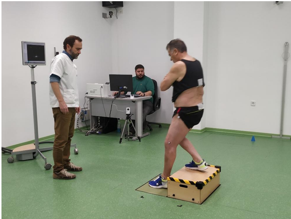
Figura 2. Prueba biomecánica para la evaluación del gesto de subir y bajar un escalón en un paciente con prótesis de rodilla.

El servicio, que se está desarrollando en el proyecto outcomes , incluye tres niveles de seguimiento de la actividad del paciente a lo largo del tiempo que permitirán, por un lado, conocer en qué pacientes están funcionando correctamente los implantes, y por otro, aquellos que empiezan a evidenciar problemas funcionales, requiriendo seguimientos más exhaustivos y, en caso de ser necesario, acciones correctivas que eviten el fracaso de la prótesis (Figura 2).