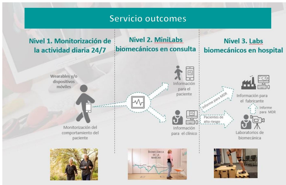
Figura 3. Servicio que se está desarrollando en el marco del proyecto outcomes para el seguimiento del estado funcional de pacientes con prótesis de rodilla.

El segundo nivel consiste en la realización de pruebas biomecánicas simplificadas realizadas en la consulta médica . En la actualidad las pruebas biomecánicas son evaluadas en sofisticados laboratorios mediante sistemas de fotogrametría para el estudio cinemático y plataformas dinamométricas para registrar la fuerza de reacción. Uno de los objetivos innovadores del proyecto outcomes consiste en llevar estas tecnologías y procedimientos a la consulta médica, a través de tecnologías portables y procedimientos simplificados de medida. Eso es posible gracias al uso de técnicas avanzadas de análisis y machine learning que permiten aunar la potencia de las metodologías y los sistemas de medida de laboratorio con la portabilidad, versatilidad y bajo coste de los sensores inerciales.