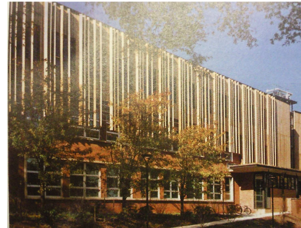
Escuela de educación secundaria Sidwell Friends Middle en Washington, DC. Kieran Timberlake.

La idea de crear una fachada potente que acote el espacio urbano se consigue con un cerramiento de lamas verticales de madera. Este cerramiento está basado en el de Kieran Timberlake en la escuela secundaria de Sidwell Friends Middle en Washington.