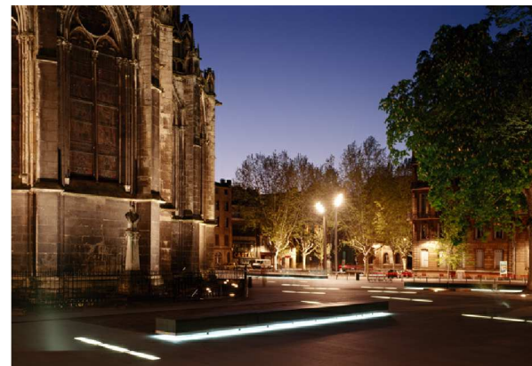
Plaza de Pey-Berland, Bordeaux, Patxi Mangado

Esta referencia que usamos nace de la necesidad de acotar el espacio y crear un paseo que invite a entrar a la biblioteca.