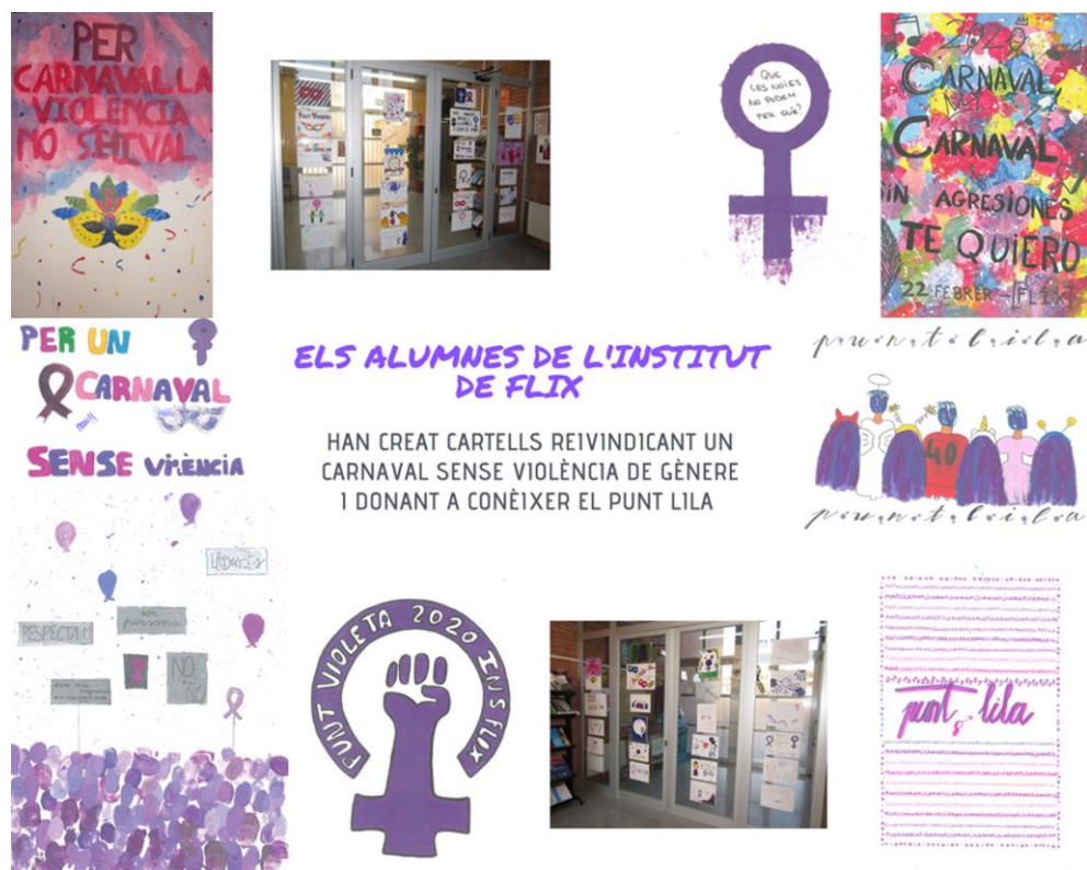
Fig. 2 Noticia con imágenes de los carteles y su exposición a la entrada del centro