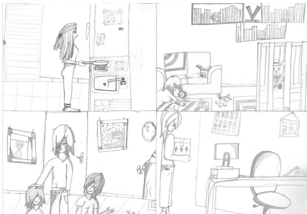
Fig. 3 El día de una mujer trabajadora y su conciliación familiar (gracias a Agda)