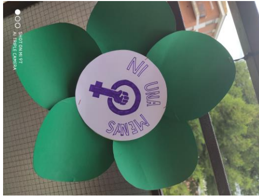
Fig. 4 Motivo floral en el balcón con mensaje en contra de la violencia de género