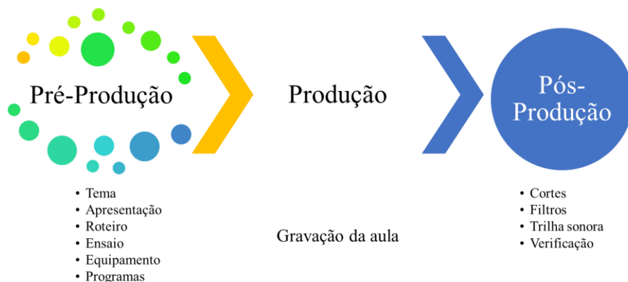
Fig. 1 Etapas da produção de vídeo-aula

Este é um estudo de caso da experimentação de uma professora no uso de ferramentas de gravação e edição de vídeo-aulas. A gravação da vídeo-aula obedeceu as etapas do fluxograma da Figura 1.