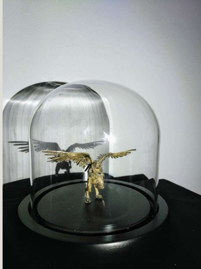
Título: Mi Ba. Técnica: Microfusión. Bronce. Medidas: 5 x 10 cm