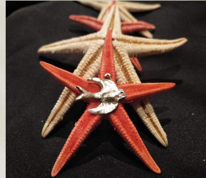
Título: Colgante golondrina. Técnica: Microfusión. Bronce. Medidas: 2,5 x 1,5 cm.

Obras realizadas durante el presente curso 2020-2021, en la asignatura Fundición artística, con la profesora Carmen Marcos Martínez.