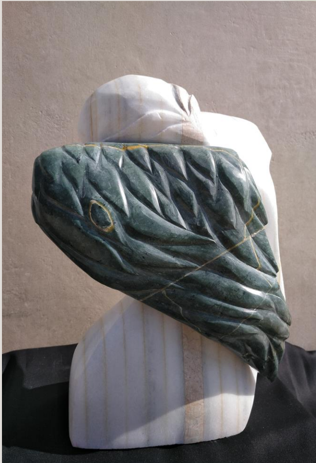
Título: Vuela alto. 2019. Técnica: Talla de mármol. Medidas: 30 x 20 x 17 cm.

Obras realizadas durante el curso 2018-2019, en la asignatura Talla de piedra, con el profesor Armand-Tierry Pedrós Esteban.