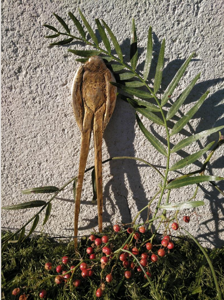
Título: Pincho golondrina. Técnica: Latón. Medidas: 20 x 4 cm.