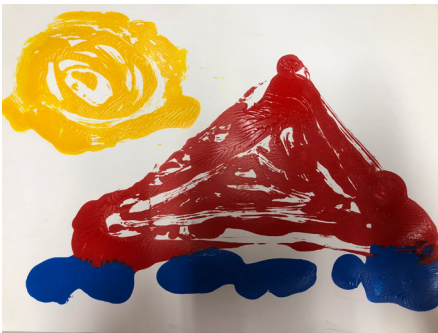
Fig 20. Sesión 2.