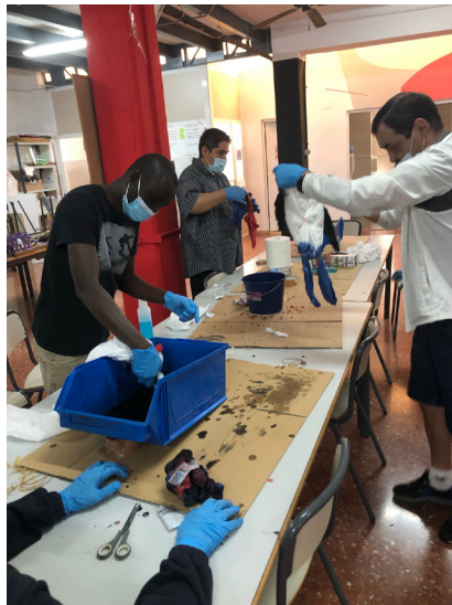
Fig 3. Sesión 1. Proceso de teñido.

La intervención de la Mediación Artística consiste en fomentar el respeto, la tolerancia y la diversidad, creando un espacio de bienestar y de empatía para favorecer el crecimiento y el desarrollo, de este modo crear vínculos y acompañar en la reflexión y la mejora de la autoestima personal a través de un aprendizaje artístico y cultural realizado de una forma lúdica.