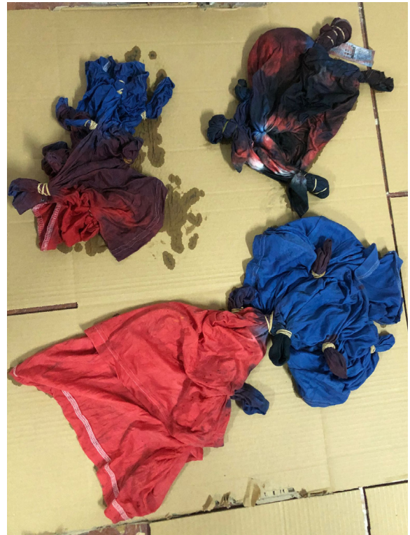
Fig 14. Proceso de secado. Sesión 1.