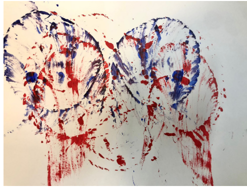
Fig 18. Sesión 4.