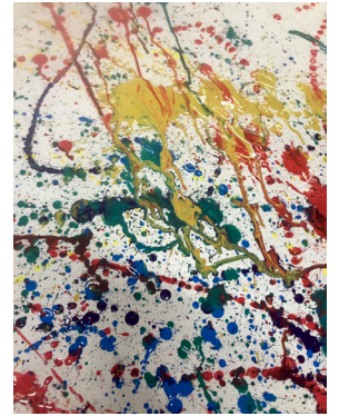
Fig 19. Sesión 4.