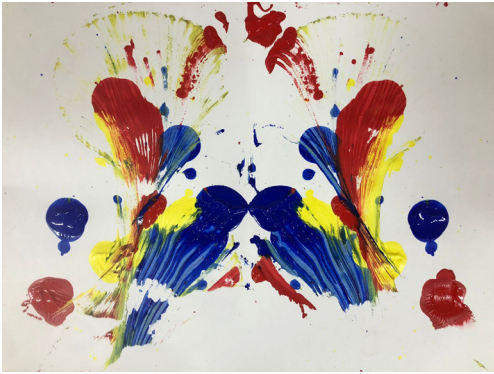
Fig 17. Sesión 4.