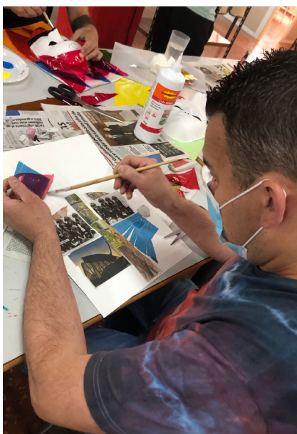
Fig 9. Sesión 3. Picasso y la deconstrucción. Collage.