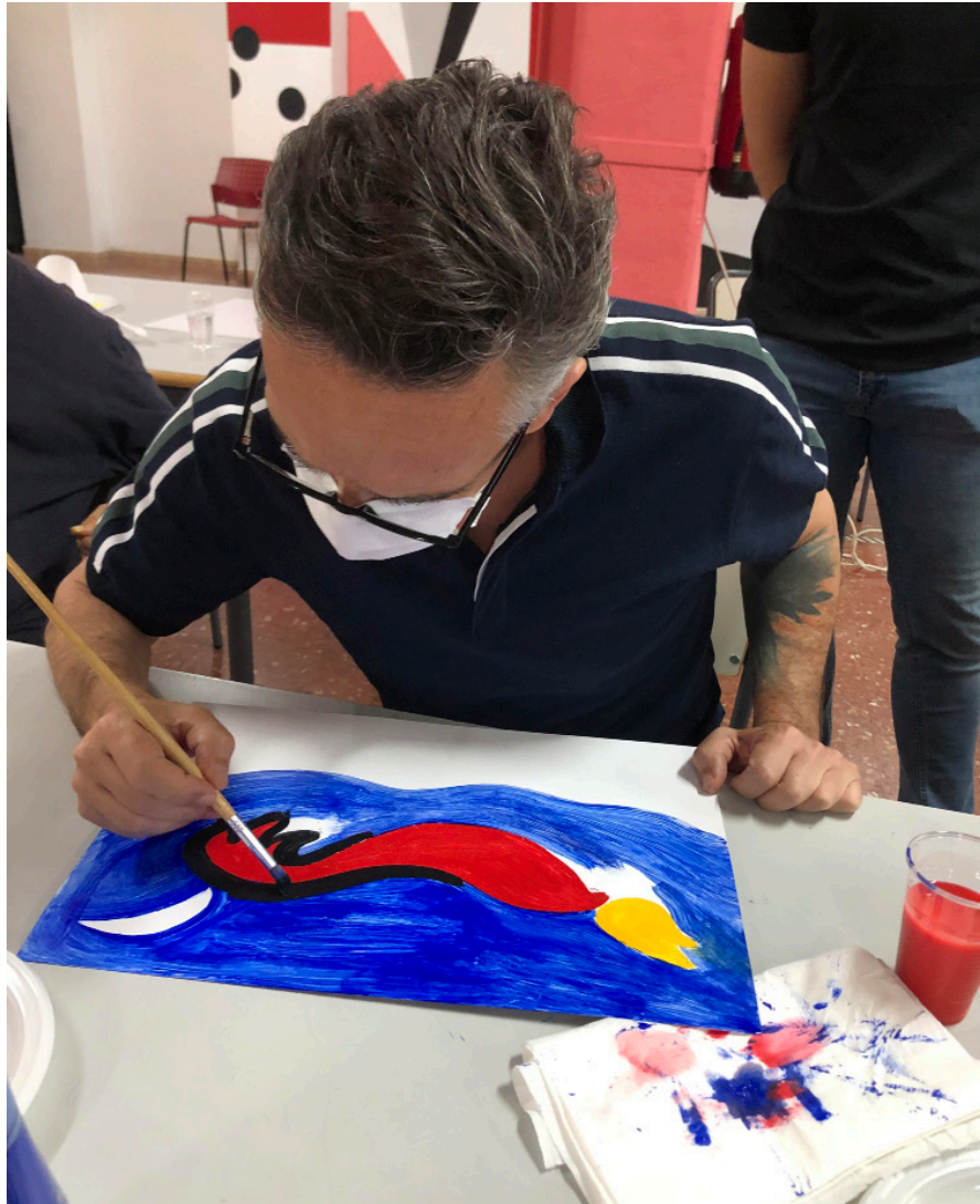
Fig 1. Sesión 2. Taller Joan Miró y la mirada infantil.