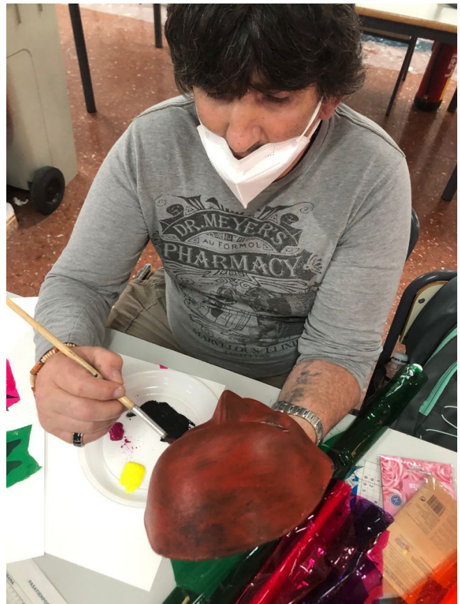
Fig 14. Sesión 3. Picasso y la deconstrucción. Máscaras.