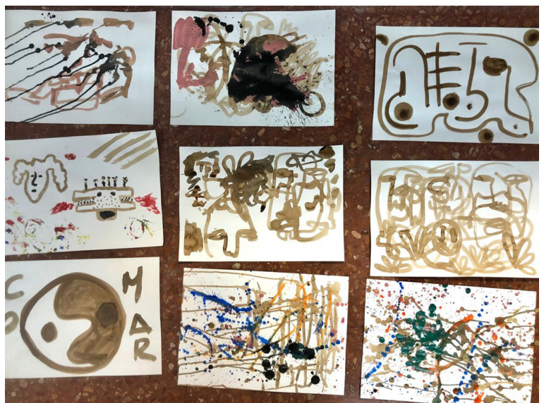
Fig 16. Sesión 4. Expresionismo abstracto. La emoción ante la representación. Formatos A3