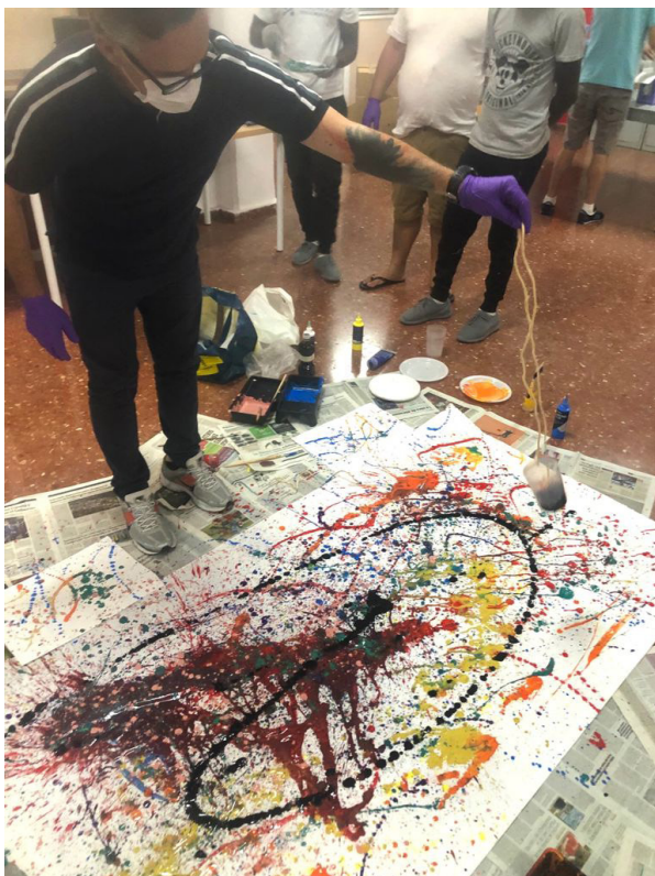
Fig 15. Sesión 4. Expresionismo abstracto. Dripping. 2m x 1m acrílico sobre papel continuo.