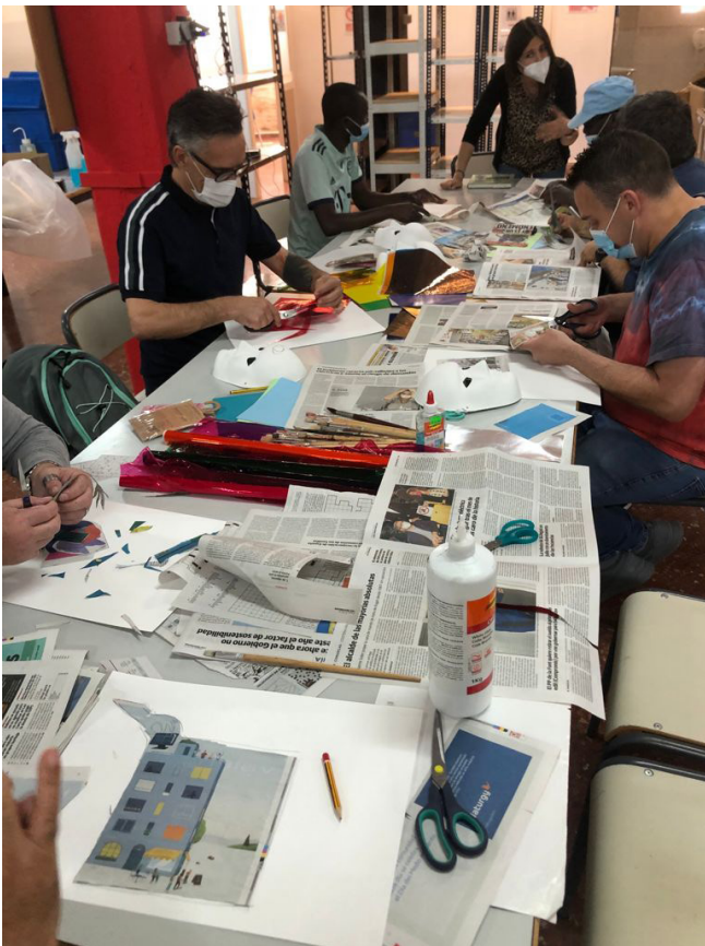
Fig 17. Sesión 3. Picasso y la deconstrucción. Collage.