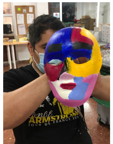
Fig 25. Sesión 3.