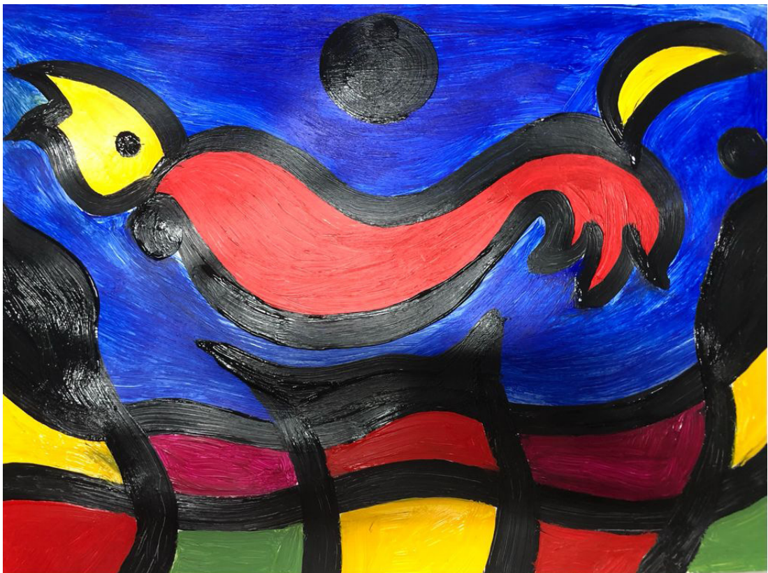
Fig 2. Obra realizada por Vasco. Formato A3. Sesión 2.