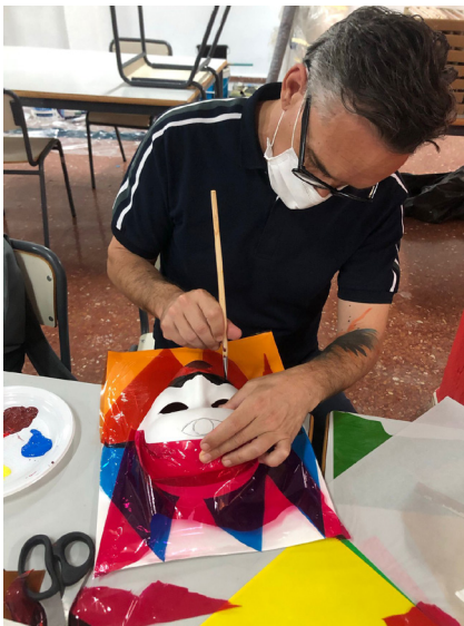
Fig 8. Sesión 3. Picasso y la deconstrucción. Máscaras.