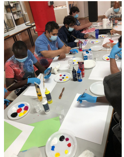
Fig 4. Sesión 2. La mirada infantil.