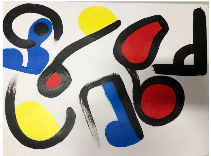
Fig 16. Obra realizada por Luis Manuel. Sesión 2.