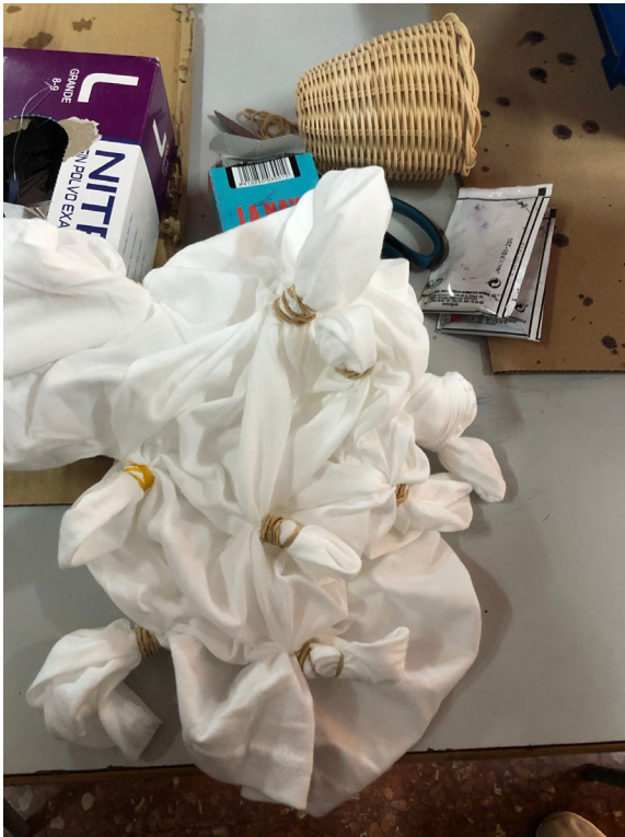
Fig 13. Proceso de anudado. Sesión 1.