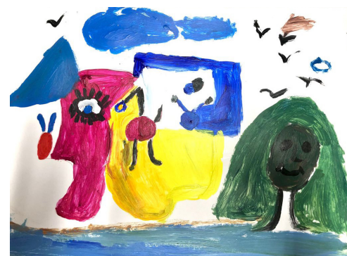
Fig 12. Sesión 2. Formato A3