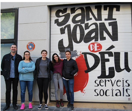
Fig 5. Personas del centro ocupacional San Juan de Dios.

Sus instalaciones consiguen que los usuarios se encuentren en una zona de confort, que además de contar con espacios amplios y acon-