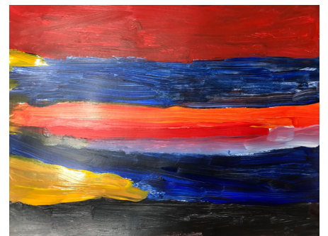
Fig 22. Sesión 2.