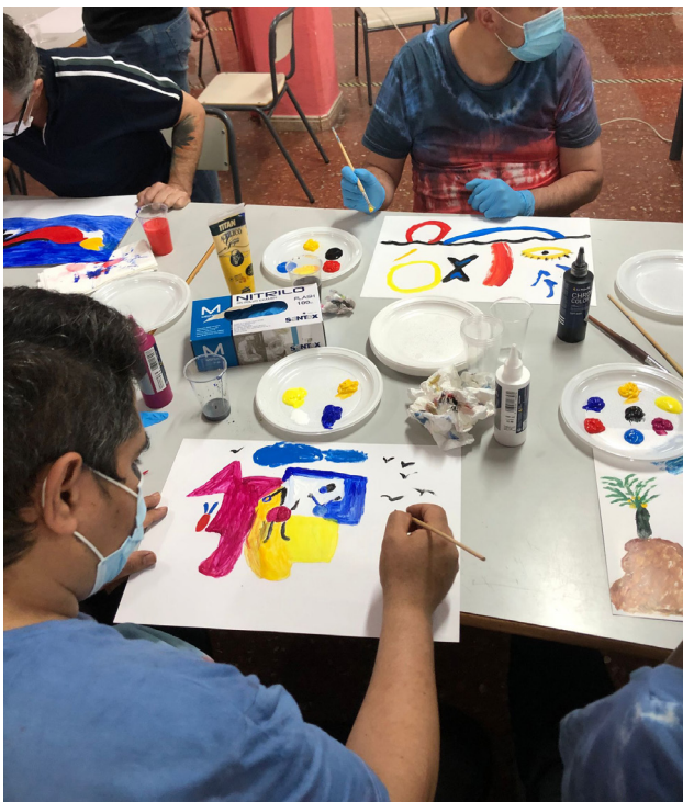
Fig 15. Búsqueda de la mirada infantil. Sesión 2.