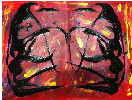
Fig 21. Sesión 2.