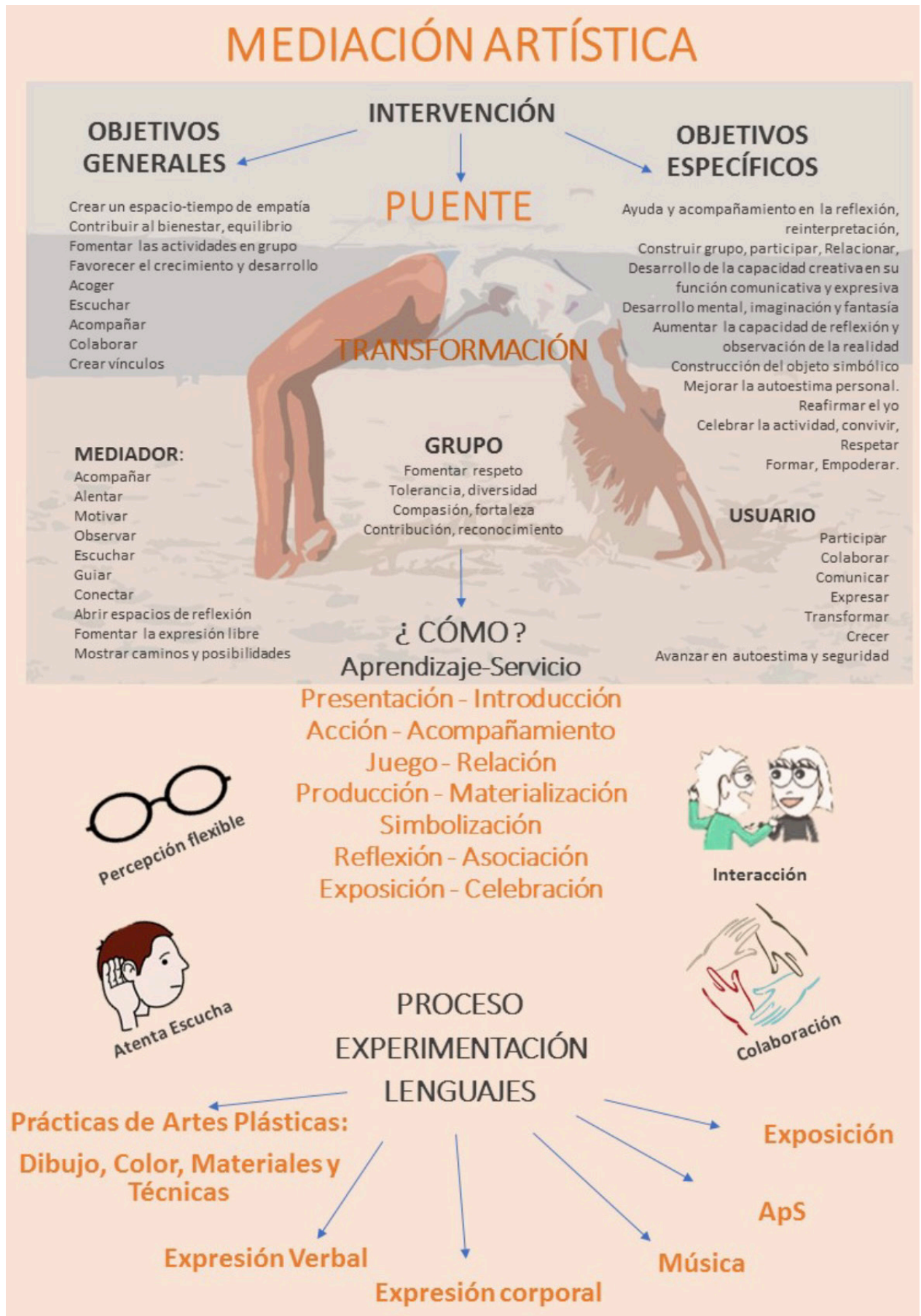
Fig 7. Organigrama. Proyecto de Mediación Artística Arte(IN)visible para la Universidad Pablo Olavide de Sevilla. 2020.