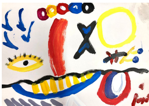
Fig 10. Sesión 2. Formato A3