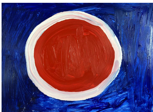
Fig 11. Sesión 2. Formato A3