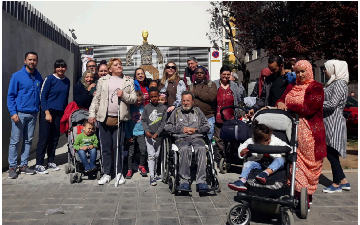
Fig 6. Usuarios con los que se trabajó anteriormente en Casa Caridad.

Fue una experiencia bastante satisfactoria, realicé junto a mis compañeras un total de 5 sesiones, aprendimos a enseñar, que no es tarea fácil y se creó un ambiente muy cercano y distendido. Los usuarios estuvieron muy participativos y mostraban interés y entusiasmo, el número de asistentes iba creciendo conforme pasaban las sesiones. 3