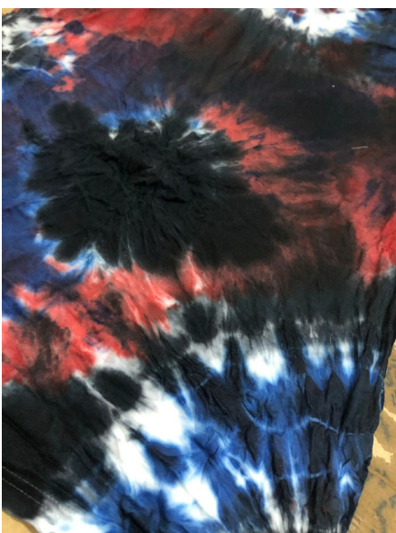
Fig 23. Sesión 1.