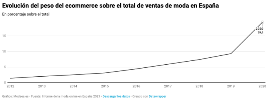
Gráfico 3: Evolución del peso del e-commerce sobre el total de ventas de moda en España