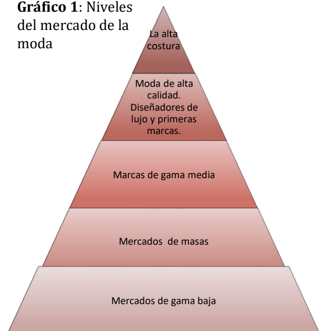
Gráfico 1: Niveles del mercado de la moda

Fuente: Libro: Marketing de Moda (Posner,2016)