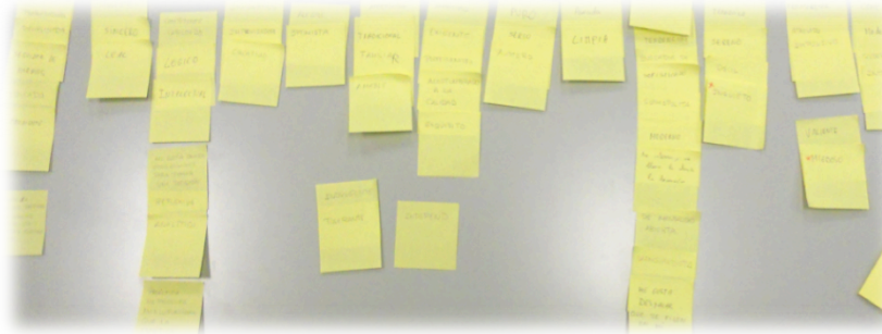
Diagrama de afinidad.