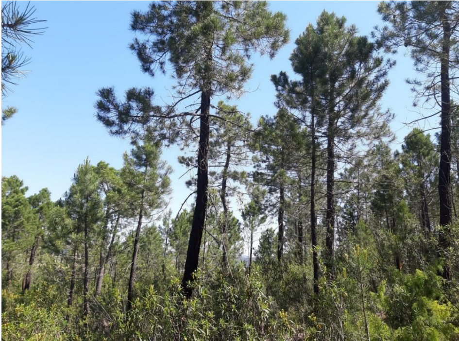
Figura 5: Fotografía de la parcela 5.

La parcela 6, situada también en el rodal 2, se encuentra en un terreno con pendiente no muy pronunciada, entre el 20% y el 30% de pendientes, esta parcela posee varios claros reducidos dentro del dosel donde no se observan pies sumergidos ni dominados. Se pueden observar, según los datos medidos, que el diámetro medio son 22 cm, siendo la mayor parte de los diámetros mayores de 24 cm, por lo que se observan pies dominados y pies claramente dominantes.