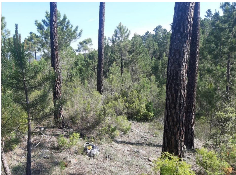
Figura 4: Fotografía de la parcela 4.

La parcela 5 se sitúa en el rodal 3 y se encuentra en un terreno algo inclinado, con unos valores de pendiente muy próximos al 20%, esta parcela posee algunos claros de reducido tamaño dentro de la masa, se pueden observar según los datos aportados que el diámetro medio son 19 cm pese a que sí se observan los datos medidos se puede apreciar que hay pies claramente dominados, cerca de los 10 cm de diámetro. En cuanto a la altura dominante, el árbol de mayor grosor alcanza los 11,36 metros de altura.