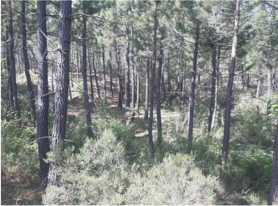
Figura 1: Fotografía de la parcela 1.

La parcela 2, perteneciente al rodal 4, se encuentra en un terreno llano, cercano al 15% de pendiente, próximo a una vaguada. Hay mayor separación entre los pies que en la parcela 1 y hay una menor cantidad de pies notable, estos pies que conforman la masa parecen ser de la misma edad.