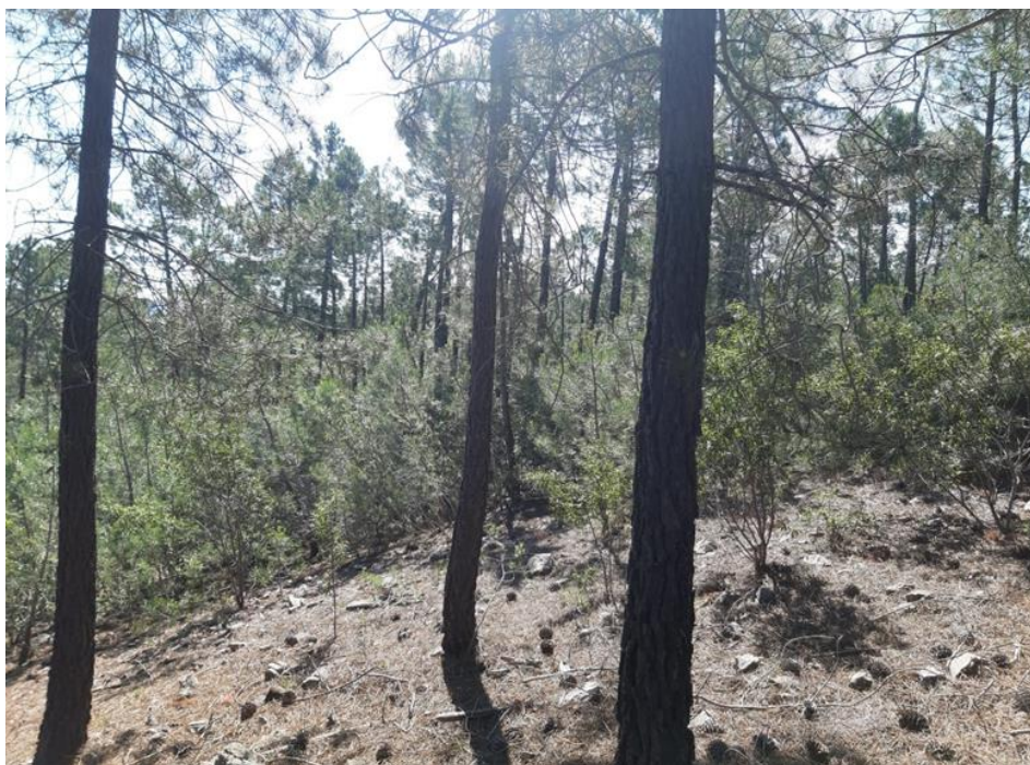
Figura 6: Fotografía de la parcela 6.