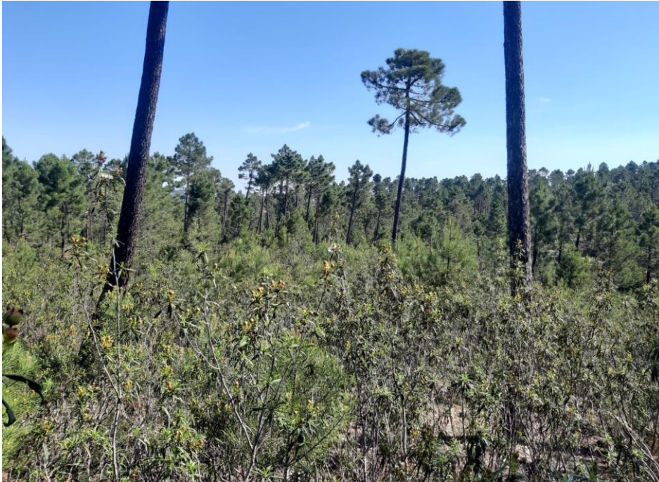
Figura 2: Fotografía de la parcela 2.

La parcela 3, situada en el rodal 2, se encuentra en un terreno con pendiente muy pronunciada en comparación con el resto de las parcelas, de entre el 25% y el 30% de pendiente, es la parcela con mayor densidad de las seis, diferenciándose con mucha facilidad los árboles pertenecientes a las primeras clases de Kraft con el resto. Coinciden los diámetros de 25 y 30 cm con los árboles dominantes, mientras que los diámetros cercanos a los 10 cm son árboles de clase 4 y 5 de Kraft. Estos pies de reducidos diámetros a menudo están doblados y sin prácticamente desarrollar su copa. Al contrario, los pies de diámetros cercanos a los 30 cm poseen fustes rectos que disponen de copas más desarrolladas, a parte de una altura claramente mayor al resto. En cuanto a la altura dominante, el árbol de mayor grosor alcanza los 9,94 metros de altura.