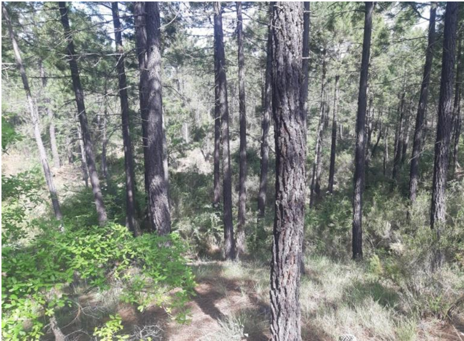
Figura 3: Fotografía de la parcela 3.

La parcela 4 corresponde al rodal 6 y se encuentra en un terreno con pendiente con poca inclinación, entre el 15 y el 20% de pendiente, que se va acentuando a medida que se acerca a la vaguada que se sitúa al fondo de la imagen.