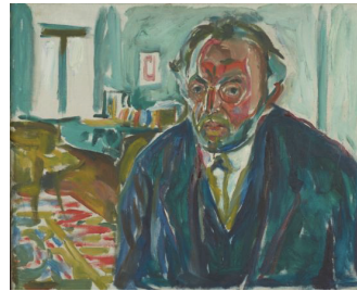
Figura 4. Autorretrato con la gripe, Edvard Munch (1919) Figura 5. Autorretrato después de la gripe, Edvard Munch (1919)

En el mismo año la gripe de 1918 nos arrebató a otro genio, Gustav Klimt. En la cúspide de su carrera artística, Gustav Klimt sufrió un derrame cerebral severo que lo dejó parcialmente paralizado. Tuvo que ser hospitalizado y estando allí contrajo la mortal gripe española. Menos de un mes después, murió de una neumonía severa. Su obra Muerte y vida (1910-15) expresa la oleada humana que transmite una impresión vibrante y esperanzadora, los cuerpos desnudos están apilados y rodeados por una colorida abundancia de flores y ornamentación. Cada grupo de edad está representado, desde la niñez hasta la vejez, en esta descripción del círculo interminable de la vida, la imagen representa una alegoría universal a través de la cual el artista ejemplificó el ciclo de la vida humana. El círculo de la vida se repite.