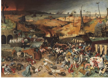
Figura 1. El triunfo de la Muerte, Pieter Bruegel el Viejo (1562)

Durante el período barroco, prevaleció la pintura catalogada como vanitas , empleando la moral religiosa como metáfora. Los artistas pintaban bodegones a partir de cráneos, huesos e incluso flores o frutas que evocaban la muerte y la fragilidad humanas. La vanitas es un género pictórico que viene del arte funerario, surgido por las crisis de subsistencias y la extensión de la peste bubónica.