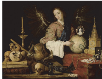
Figura 3. Alegoría de la vanidad, Antonio de Pereda (1635)