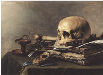
Figura 2. Vanitas still life, Pieter Claesz (1630)

Las obras Vanitas still life (1630) de Pieter Claesz y Alegoría de la vanidad (1635) de Antonio de Pereda son ejemplos de este género que reflejaron esta situación utilizando de manera dramática la luz y las sombras en busca del impacto, la conmoción del espectador. “ Vanidad de vanidades, todo es vanidad. ”, en palabras de Salomón, recogidas en la Biblia, en el libro de Eclesiastés. La idea resalta la importancia de la muerte y la vacuidad de los placeres mundanos y hasta de la vida misma. En este sentido, la vanitas estaría intentando demostrar lo relativo del conocimiento y la vanidad del ser humano, que no puede librarse del paso del tiempo y, por supuesto, de la muerte. Simoni (2007)