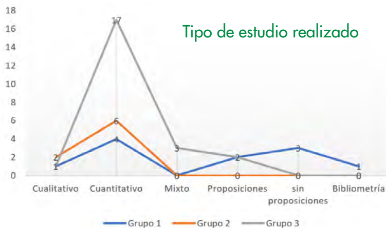
Figura 2. Análisis de los estudios realizados en función de su tipología