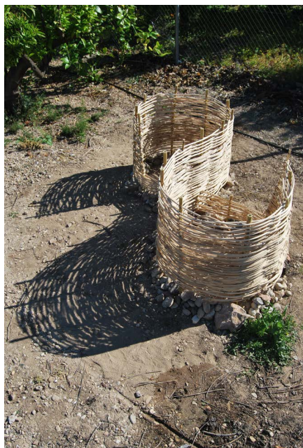
Figura 4 · Enriqueta Rocher, Recetario hecho con amor borde , 2019. Fuente: cesión del artista.