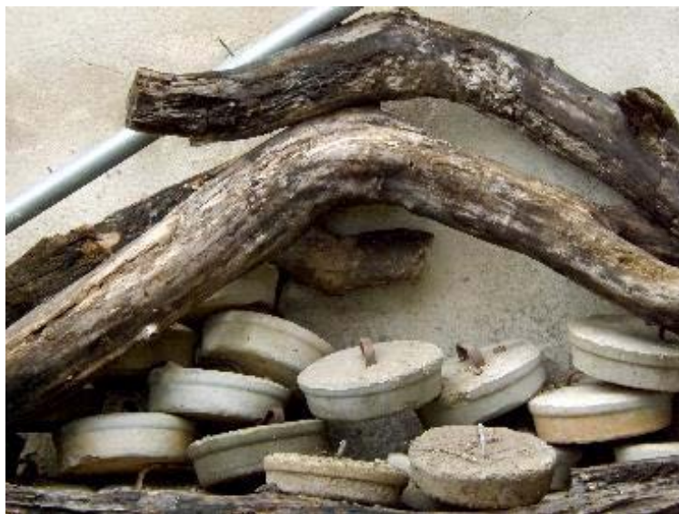
Figura 1 · Pau López Anquela, Trastellaors , 2019.