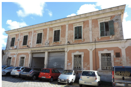
Figura 11. Mercat d'ous de corral, Campasso, Gènova. La façana principal

Figure 10. The Soldier's House, Genova. Detail of the main entrance, typical of rationalist style, actually abandoned