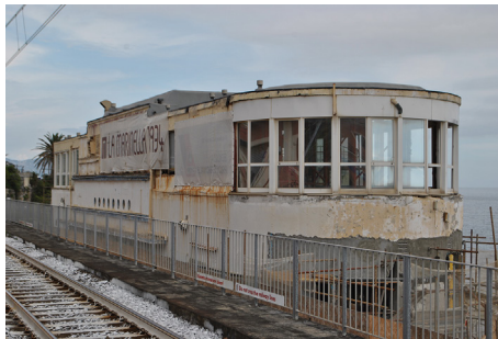
Figura 1. Hotel Marinella, Gènova Nervi. L'edifici s'alça enfront de la mar, al llarg d'una passarel·la. La ubicació ambiental provoca riscos de danys i degradació

No obstant això, no és tant o només la degradació material, sinó la falta de reconeixement dels valors (materials i immaterials) d'aquest patrimoni el que genera una certa reticència a l'hora d'identificar i aplicar mètodes de conservació adequats a aquests artefactes, preferint demolicions més o menys extenses (Figura 2).