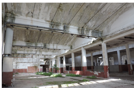
Figura 12. Mercat d'ous de corral, Campasso, Gènova. Espais interiors, voltes de formigó armat

Figure 11. Poultry Egg Market, Campasso, Genova. The main facade