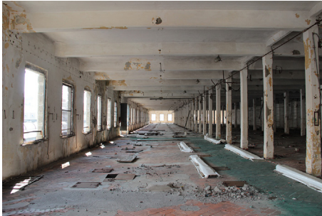
Figura 4. Sitges de gra "Hennebique". Vista dels espais interiors

Figure 3. Grainary Silos "Hennebique", Genova. One of the first warehouses built with Hennebique patent at the beginning of twentieth century, abandoned since decades, is waiting for a new life