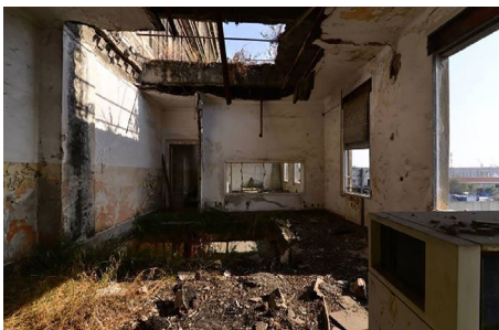
Figura 5. Sitges de gra "Hennebique". Estat de conservació

Figure 4. Grainary Silos "Hennebique". View of the internal spaces