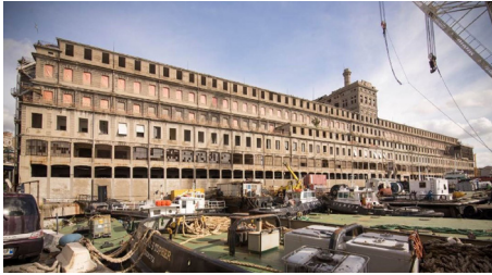
Figura 3. Sitges de gra "Hennebique", Gènova. Un dels primers magatzems construïts amb palés Hennebique a principis del segle XX, abandonat des de fa dècades, espera una nova vida

Moltes de les investigacions desenvolupades pels autors en aquest camp temàtic, tant en l'àmbit local com nacional i internacional 6 , comparteixen, almenys en part, una visió i un enfocament metodològic orientat sobretot a reconèixer els valors del patrimoni arquitectònic i urbà recent, sovint oblidat, rebutjat o enterbolit pel pas del temps i els processos de decadència i obsolescència que l'afligeixen. Per a això és necessari reflexionar primer sobre el concepte de "historització" i l'atribució de valor històric i artístic a edificis similars (Figures 3, 4, 5).