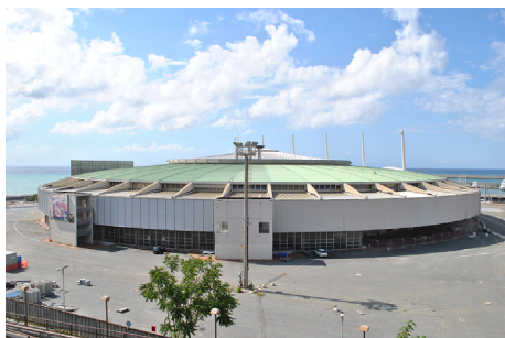
Figura 6. Palau d'Esports, Gènova. L'edifici està situat en la zona de la Fira, en el centre de la ciutat. En l'actualitat, tota la zona està en procés de renovació.

Figure 6. Sport Palace, Genova. The building is located in the Fair area, in the city centre. The whole area is actually under renovation (eastern waterfront).