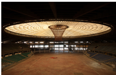
Figura 7. Palau d'Esports, Gènova. Detall de la interessant estructura de la teulada

Figure 6. Sport Palace, Genova. The building is located in the Fair area, in the city centre. The whole area is actually under renovation (eastern waterfront).