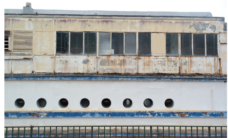
Figura 2. Hotel Marinella. Detall de l'estat de conservació

Figure 1. Hotel Marinella, Genova Nervi. The building raises in front of the sea, along a walkway. The environmental location causes risks of damage and degradation