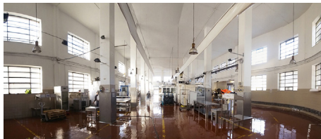
Figura 8. Mercat del peix, Gènova. Vista de l'espai interior, caracteritzat pels enormes marcs de ferro de les finestres

Els qüestionaris han rebut nombroses respostes, no sols d'experts i tècnics del sector, la qual cosa avala els esforços del nostre treball. Aquests, degudament elaborats, proporcionen indicacions útils per a les possibles repercussions operatives de la investigació en tota