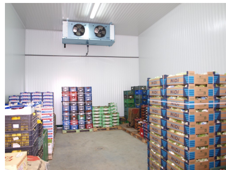
Figura 3: Cámaras frigoríficas con productos, embalajes y palés