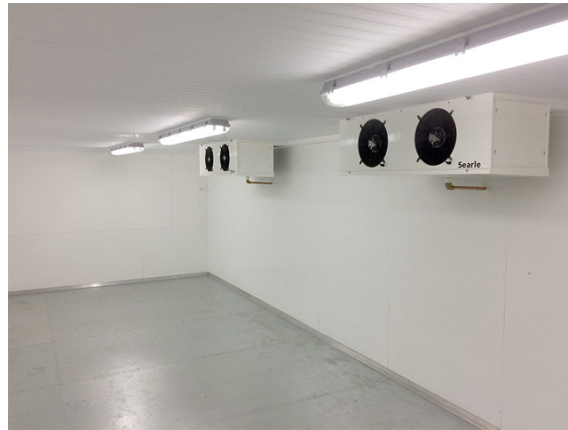
Figura 2: Vista cámara frigorífica con evaporadores y luminarias

Donde e_i es el espesor de cada capa que conforma el paramento, k_i es la conductividad térmica de cada material, h_{ext} y h_{int} son los coeficiente se transferencia de calor por convección exterior e interior.