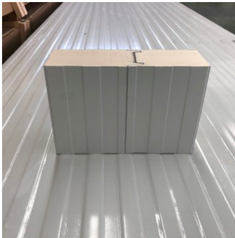
Figura 1: Panel aislante cámaras frigoríficas