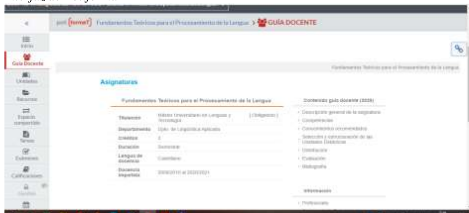
Figura 2. Interfaz de PoliformaT

unidades en las que se incluyen las tareas o actividades a realizar por los/las alumnos/as. Véase en la Figura 2 la interfaz de una de las asignaturas: