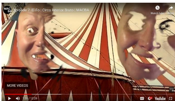
Figura 2. Serie audiovisual El Futuro . Circo Interior Bruto