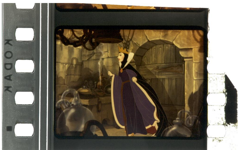
Figura 1. Blancanieves y los siete enanos,1937, Walt Disney. Fuente: Barbara Flueckiger, Timeline of Historical Film Colors.

A continuación, se presentan 2 de las imágenes analizadas la primera (figura 1) muestra a la reina en las mazmorras del castillo donde tiene su laboratorio, momentos antes de preparar la fórmula de envejecimiento y la manzana envenenada.