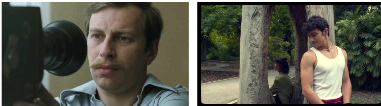
Figura 7. Comparativa entre un fotograma de Amator (1979) y un fotograma de Qué voy a hacer yo sin vosotros (2022)

consciente de que el camino que ha descubierto no tiene vuelta atrás cuando se apunte a sí mismo con el arma que casi acaba con su familia y su trabajo; la cámara.