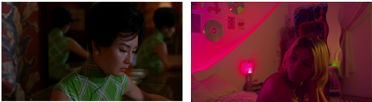
Figura 5. Comparativa entre un fotograma de In the mood for love (2000) y un fotograma de Qué voy a hacer yo sin vosotros (2022)

En estos espacios los personajes, aislados del exterior pero en conversación interna con ellos mismos serán vulnerables y mostrarán sus emociones sin tapujos ya sean estas tristeza o amor, como serán los momentos íntimos de la directora y los actores respectivamente.