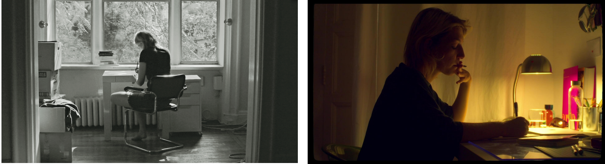
Figura 6. Comparativa entre un fotograma de Frances Ha (2012) y un fotograma de Qué voy a hacer yo sin vosotros (2022)

melancólico, ya que la conversación le hace recordar también su relación con su mejor amiga.