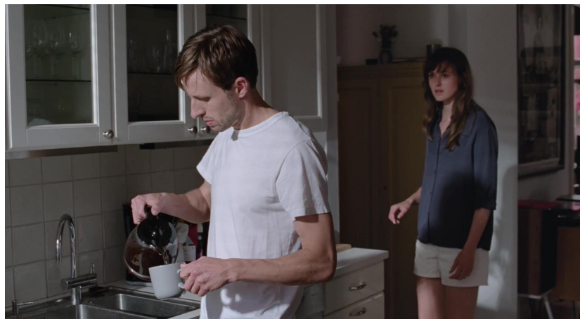
Imagen 1. Fotograma de La peor persona del mundo (2021)

En la imagen 1, Aksel permanece congelado en el mismo lugar donde Julie le dejó, deshaciendo el “hechizo” cuando vuelve a accionar el interruptor de la luz.