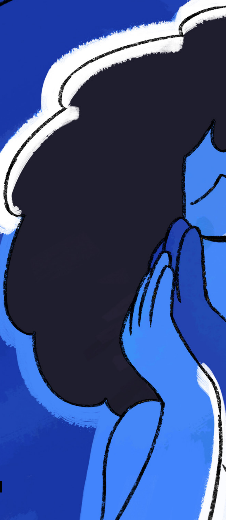
Fig. 1. Amarradas, Carmen Córdoba, 2022.