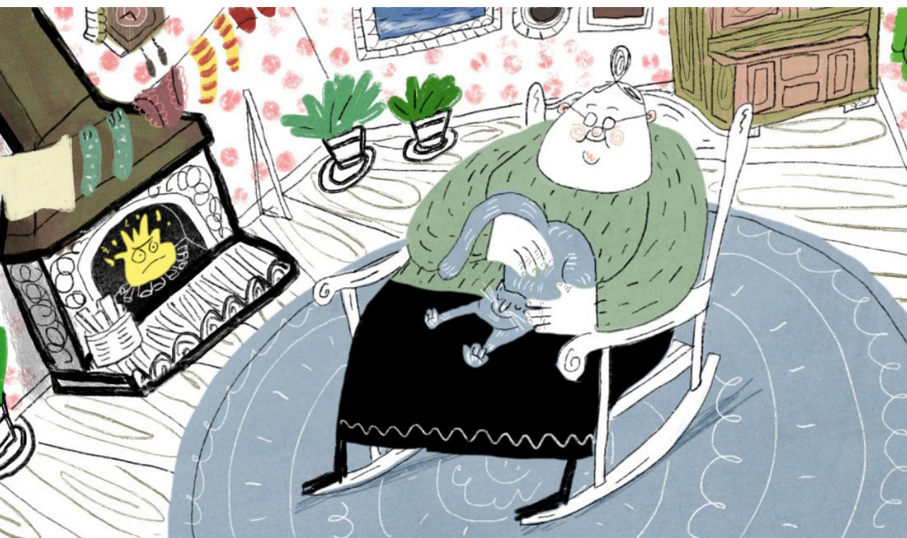
Fig. 6. A Stormy Night , Gil Alkabetz (2019).