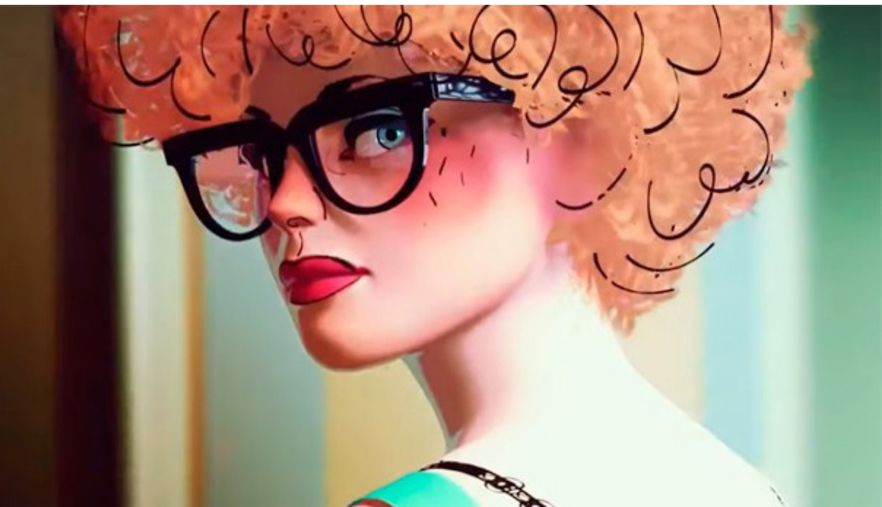
Fig. 2. El limpiaparabrisas , Alberto Mielgo, 2021.

En esta ocasión, la imagen de portada nos la brinda una de las más exitosas mujeres de la animación española actual, que no reconoce ninguna restricción temática ni de técnica: Carmen Córdoba, una ingeniera informática que en 2012 decidió dedicarse en exclusiva a lo que verdaderamente le apasiona: contar historias mediante la animación. Su ópera prima, el cortometraje Roberto (2020), realizado en animación 3D, fue una historia sobre el amor, la autoimagen y los desórdenes alimenticios, narrada con carisma y sen-