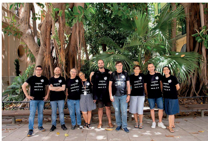
Fig. 6. Participantes en el Wiki Takes Corpus de València.

Se comienza por confeccionar una lista de lo que se quiere documentar y definiendo un espacio geográfico o un evento. Partiendo de ese marco, se establecen las características del Wiki Takes: momento en que se puede realizar, número de participantes, rutas, grupos, necesidades logísticas y de transporte.