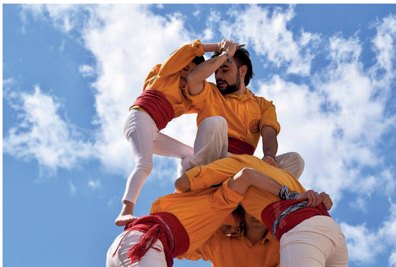
Fig. 5. Primer premi del Wiki Loves Muixerangues. Conlloga de Castelló.

La edición de los artículos fue compleja ya que se partía de artículos ambiguos, confusos y con grandes defectos de forma que se tuvieron que renombrar, redirigir y rehacer. El mismo concepto de muixeranga no está exento de controversia por ser polisémica y estar tratada tradicionalmente como una parte, vinculada únicamente a la Muixeranga d'Algemesi, y no como un todo.