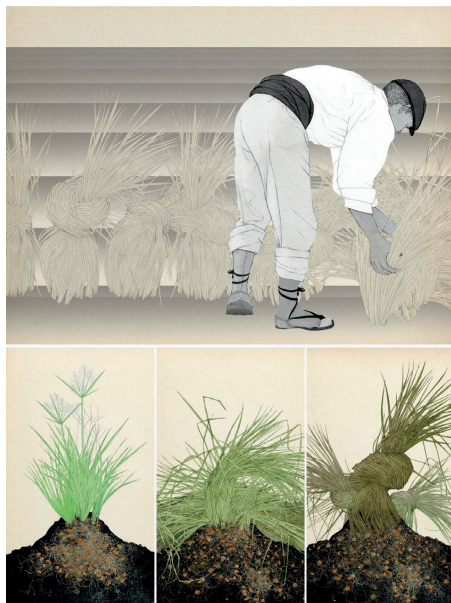
Fig. 1 Proceso del cultivo de la chufa.

En definitiva, se abre el camino a un acceso más democrático a los contenidos del museo, por tanto, la alianza Wikipedia y museo repercute claramente en una sociedad mejor informada.