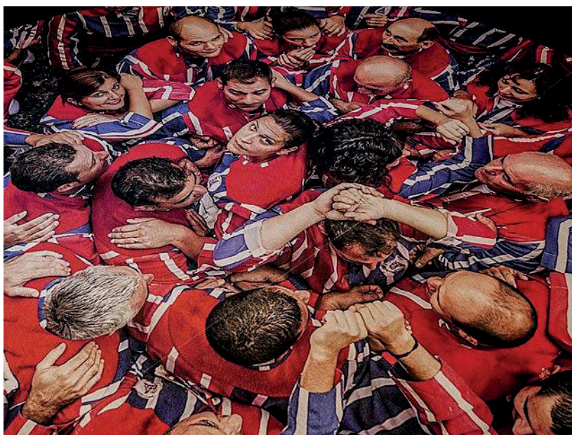
Fig. 4. Exposición Muixerangues al cel.

Participantes en el wikiproyecto: L'ETNO a través de la Biblioteca, Amical Wikimedia y Wikimedia España como entidades editoras, y la Federación Coordinadora de Muixerangues como colaboradora de la exposición y agente imprescindible para dinamizar la participación ( Viquiprojecte: Muixeranga , 2021).