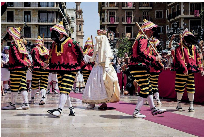
Fig. 7. Danza de la Moma. Wiki Takes Corpus 2022.

El Wiki Takes del Corpus se celebró entre el 17 y 19 de junio para cubrir todas las celebraciones de la fiesta, aunque el día más importante fue el domingo 19 cuando se celebró la Cabalgata del Convite y la Procesión del Corpus. Ese día nueve personas se repartieron por el centro histórico de Valencia para poder documentar todos los elementos de cada acto: los personajes, la indumentaria, las Rocas, el bestiario, las danzas, la música, e incluso el toque de las campanas. De 9 de la mañana a 9 de la noche se documentó cómo la ciudad de València vive esta fiesta. Los días posteriores cada participante fue liberando las imágenes a través de la página del wikiproyecto dónde existe una tabla con todos los elementos de la fiesta categorizados para poder subir las fotos fácilmente.