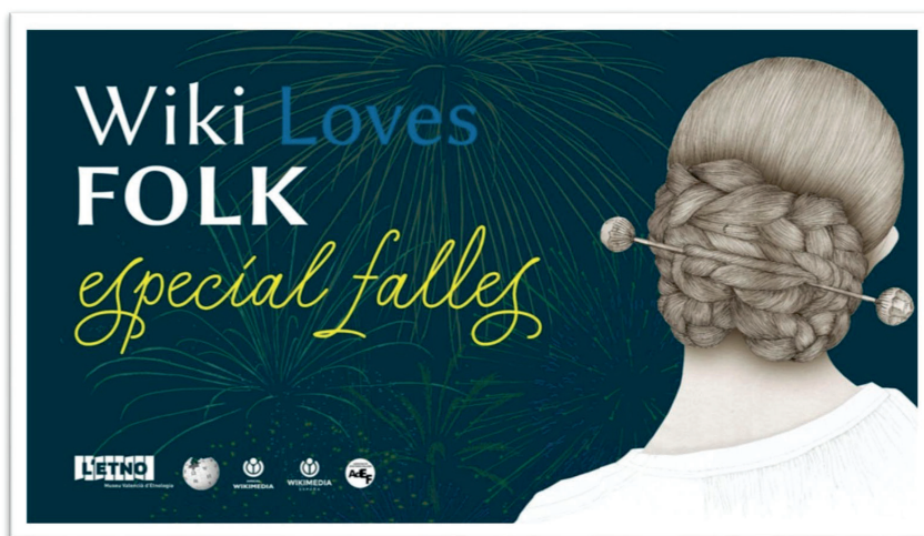
Fig. 2. Convocatoria del Wiki Loves Folk especial Falles 2020.