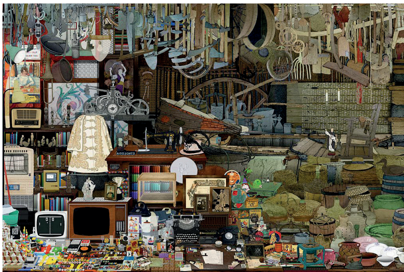
Fig 8. Cultura material. La imagen de L'ETNO más utilizada en Wikipedia. Fuente: Wikimedia Commons. Autor: Andrés Marín (L'ETNO)

Los datos de Wikipedia pueden ser cuantificados y evaluados gracias a herramientas proporcionadas por Wikimedia Toolforge Glamtools , las cuales nos aportan los siguientes datos sobre L'ETNO, Museu Valencià d'Etnologia (Fort, 2021):