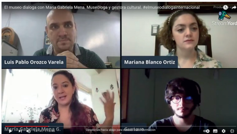
Fig. 2 Programa Museo Dialoga participación estudiantil.