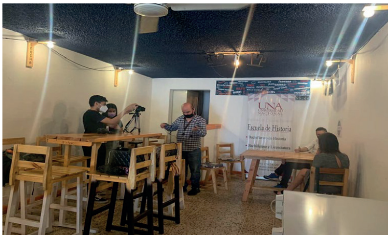
Fig. 3. Trabajo producción audiovisual Museo Dialoga participación estudiantil.