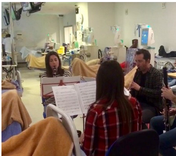
Figura 1 – Imágenes de las actuaciones.

acuerdo a la Ley de Protección de datos 3/2018 de 5 de diciembre, en el ámbito de la investigación biomédica, la protección de datos de carácter personal y la bioética.