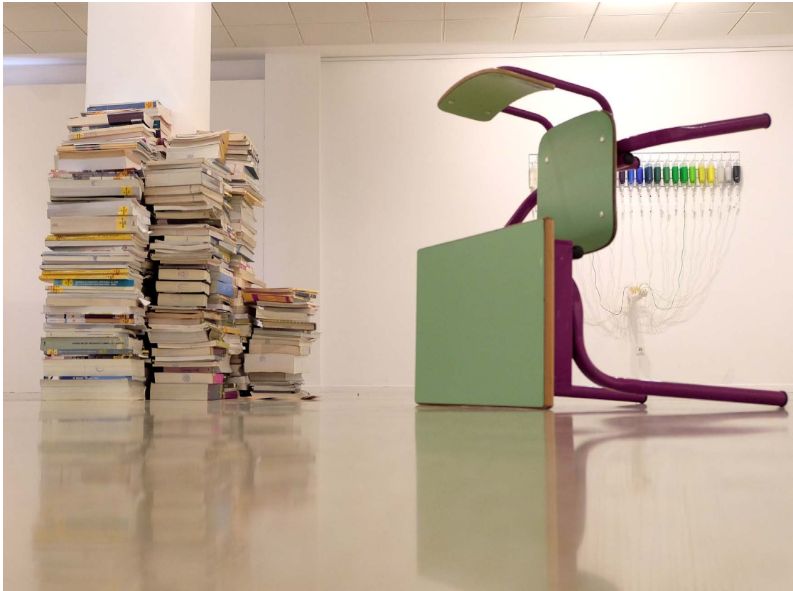
Imagen 3. Abril de 2019. Detalle obra de Nano Pía y su entorno en la sala expositiva.

formar de nuevo parte de la obra, variando día a día el contenido de la misma. Otra propuesta formaba un habitáculo cerrado al que había que acercarse para escuchar el sonido del mar o posar delante de ellas como un escenario para un futuro suvenir. En Trans-Mutare se invitaba al público a mirarse en el espejo y si lo consideraba oportuno maquillarse con el Kit que allí se presentaba. Y como colofón en la inauguración se acordó que los asistentes participaran en el espacio expositivo organizando en el acto en sí un Happening que favoreciera una actitud activa para despertar en la mente de los allí asistentes la curiosidad por lo que aún no se sabía qué.