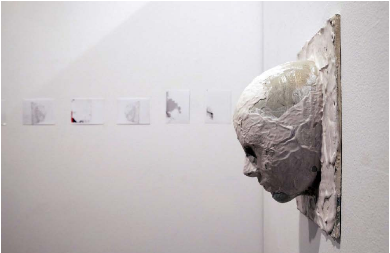
Imagen 3. Fotografía de Vicent Salvador. Abril de 2019. Objeto, imagen y texto de la obra de Irene Covaleda

Intentamos conformar, mediante el uso y la combinación de signos de expresión estética, procesos de pensamiento que favorezcan la visibilidad de las propuestas que se plantean los grupos que forman las actuales corrientes de creación. “...el arte siempre ha sido relacional en diferentes grados, o sea, elemento de lo social y fundador del diálogo.” (Nicolás Bourriaud, 2018 p.15) Las pretensiones pasan por abrir la muestra al colectivo social despertando la curiosidad para evitar a toda costa que la exposición se convierta en un ente acabado que hay que interpretar desde un razonamiento preestablecido y más o menos consensuado, huyendo de los signos y gestos artísticos propios del ámbito de “la crítica”. En definitiva, lo que queremos hacer extensible a todo el mundo es el derecho a imaginar, tal y como apunta Racionero: “El primer derecho del hombre es el derecho a imaginar. Quienes no imaginan amputan la parte creativa del cuerpo”. (Racionero, 2002, p.31).