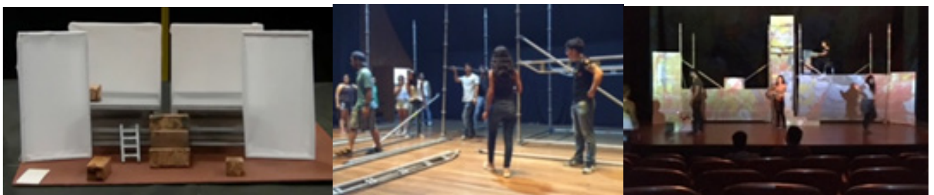
Imagen 3. Trabajo de producción escenográfica y ensayos de I Due Timidi de Nino Rota presentado en la Sala Beethoven del Instituto Departamental de Bellas Artes en Cali-Colombia en 2017

Por su parte, el artículo de Trecca (2010) presenta un panorama sobre la evolución de los estudios que atañen las relaciones entre el teatro y los medios audiovisuales en España, atendiendo la variedad de visiones sobre el tema desde sus rasgos pragmáticos hasta sus rasgos expresivos y comunicativos; es así como este trabajo se convierte en un importante punto de partida para acceder a un estado del arte sobre las relaciones entre escena, nuevas tecnologías, comunicación de masas y evoluciones performativas. Este autor presenta de forma clara y precisa el panorama crítico español desde distintas perspectivas y los enfoques de diferentes autores, que permiten a esta investigación, develar algunos aspectos de la puesta en escena teatral contemporánea que hace uso de nuevas tecnologías audiovisuales a través de los autores vigentes más influyentes. Por su parte, el artículo de Cornago Bernal (2004) hace alusión a la construcción de una nueva realidad mediática, debido a las implicaciones que tienen los grandes medios de comunicación como agentes de transformación de las distintas formas