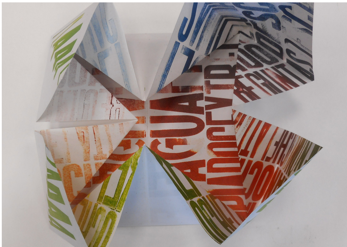
Fig. 1 Trece lunas. Obra de A.Familiar y E.Ferré. incluida en el L.A Bajo Presión (2017)

En el campo de la educación y la enseñanza escolar de los niños, a partir de la segunda mitad del siglo XIX, se empezaron a manifestar determinados cambios e inquietudes, por parte de algunos pedagogos, en cuanto a los métodos de formación de sus alumnos, tales cambios se vieron traducidos en la obtención de diferentes resultados, según el sistema aplicado. La escasez de medios existentes en la enseñanza, especialmente en el mundo rural y en poblaciones muy pequeñas, hizo agudizar el ingenio