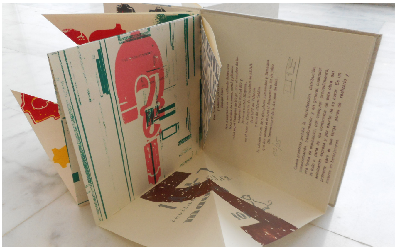
Fig. 4 10.000 cm 2 . d'espai imprés Livre d'Artiste de E.Ferré

Los escolares, en su momento, estaban muy ilusionados en poder publicar sus textos impresos y divul-