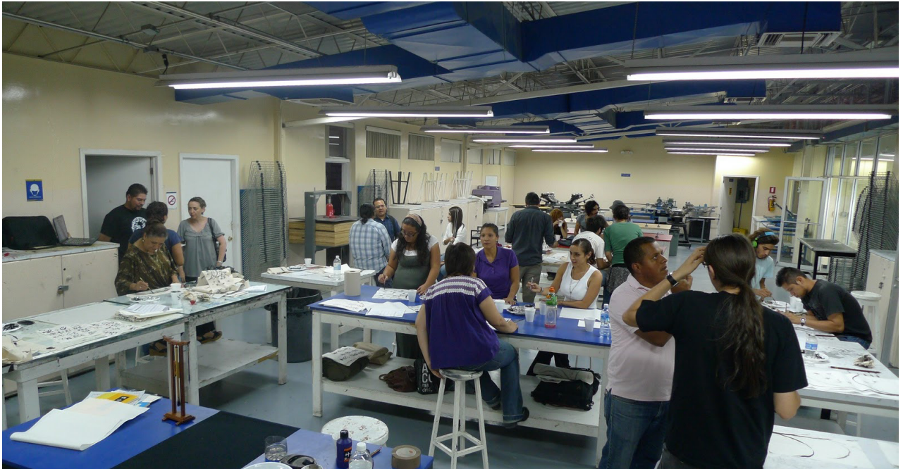
Fig. 1. Alumnos y docentes de la MEPCAD trabajando en el Taller de Gráfica del Instituto de Arquitectura, Diseño y Arte, (IADA), Universidad Autónoma de Ciudad Juárez.

área de Artes como docente, artista e investigadora adscrita a la Maestría en Estudios y Procesos Creativos en Arte y Diseño (MEPCAD), de la Universidad Autónoma de Ciudad Juárez (Fig. 1). Institución en la que laboramos y desde la cual, hacemos y pensamos al Arte, desde diferentes perspectivas.