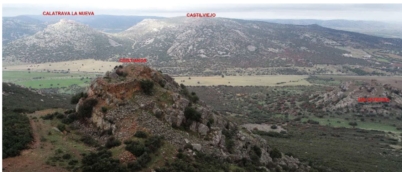
Fig. 3 Vista panorámica en la se aprecian en primer plano las ruinas del Castillo de los Cristianos, Salvatierra, Castilviejo y Calatrava la Nueva.

Desde el punto de vista de la protección patrimonial, Salvatierra se ha visto afectado directa o indirectamente por las diferentes normativas de ámbito nacional y autonómico, como es el caso, por poner uno de los ejemplos más conocidos, del célebre Decreto de 22 de abril de 1949 sobre protección de los castillos españoles (BOE, 1949, nº 125). Ya en los albores del Estado Autonómico, la Dirección General de Bellas Artes y Archivos del Ministerio de Cultura dio por incoado el expediente para la declaración de monumento histórico-artístico, a favor del Castillo de Salvatierra (BOE, 1983, nº 90). La demora en la ejecución del procedimiento, unido a la publicación de la Ley 16/1985 de 25 de junio del Patrimonio Histórico Español (LPHE), postergó la tramitación de las acciones protectoras hasta el año 1989 cuando, a propuesta del Ayuntamiento de Calzada, se comenzó a trabajar en su declaración específica como Bien de Interés Cultural, con la categoría de Monumento . La resolución llegaría el 24 de abril y el área de protección quedó definida por un círculo de 150 metros de radio alrededor del castillo (DOCM, 1989, nº 17). Tres años después se procedía a su declaración definitiva mediante el Decreto 96/1992 de 23 de junio (DOCM, 1992, nº 51). En todo caso, dado su carácter privado y su grado de deterioro, Salvatierra se mantiene únicamente como un recurso patrimonial cerrado a la visita pública libre.