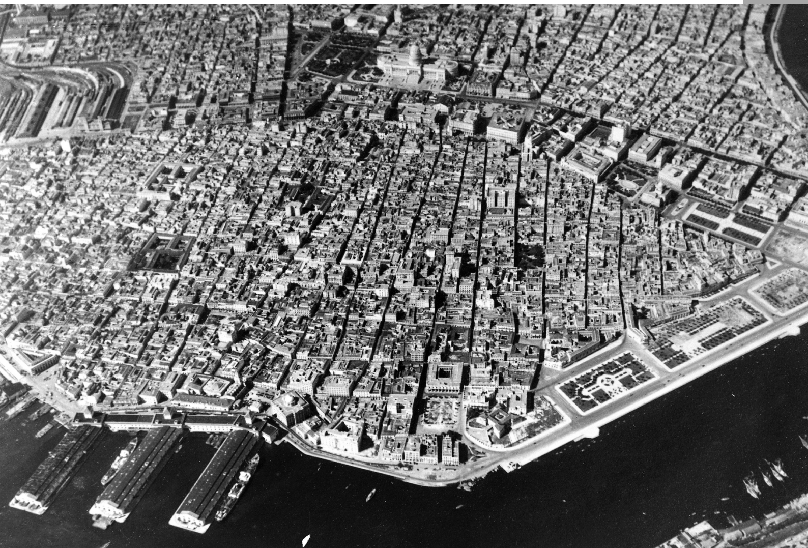
Foto aérea de La Habana, 1929. Secretaría de Obras Públicas - Negociado de Construcciones Civiles y Militares, La Habana.