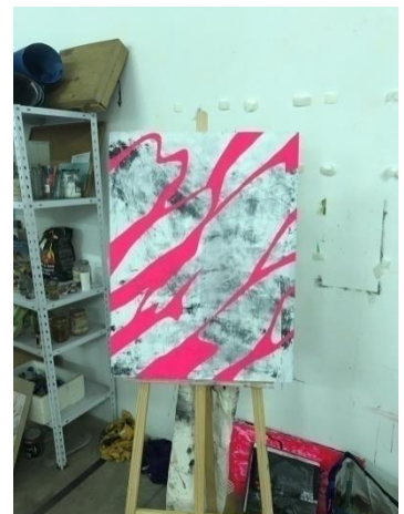
Fig. 41. Procés pictòric d' Eclipses .