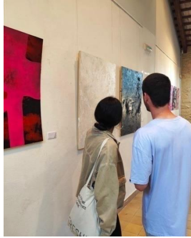
Fig. 42. Inauguració La presència de l'absència . 11 d'abril de 2023.