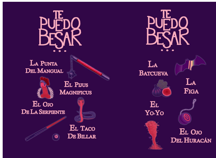
Figura 11: Ejemplo de ilustraciones que vendíamos en el Visoren Fest. [Elaboración propia].

Fueron 20€ lo que pude obtener a la hora de repartir el dinero, era poco, pero bastaba, así que yo puse otros 20€ de mi dinero y compré la base exclusiva (véase figura 11).