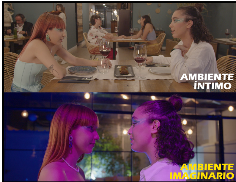
Figura 13: Diferencia de iluminación entre el ambiente íntimo (iluminación normal) y el ambiente imaginario (iluminación más fantástica). [Elaboración propia].