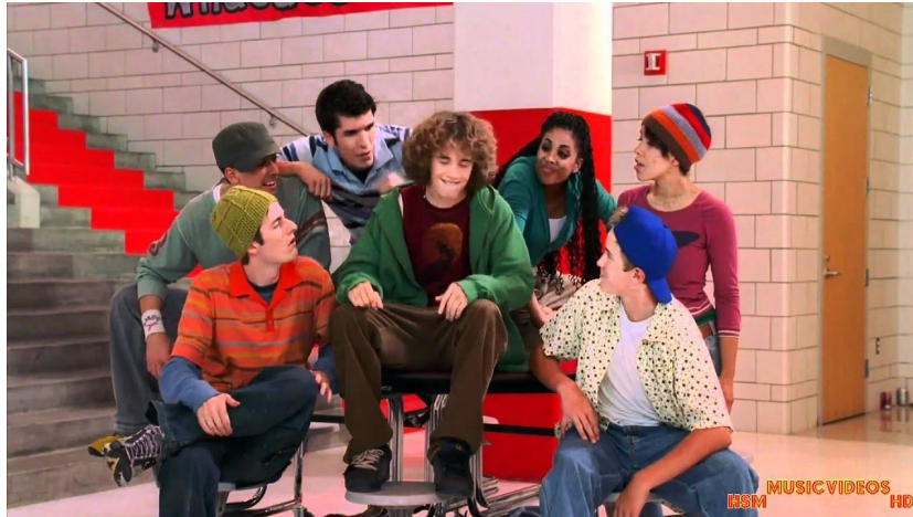
Figura 3: Frame extraído del musical High School Musical, más concretamente en la canción Stick To The Status Quo, donde se representa la idea de enfatizar al actor principal, mientras que los extras sirven de apoyo alrededor.

Esto, sin duda (a parte de los coros, el baile, el ritmo...) tuvo mucha repercusión a la hora de componer, ya que queríamos dar un sonido y un final apoteósico, por lo cual llegamos a la conclusión de que, para conseguir un final como este, necesitábamos coros, coreografía, cambios de ritmo y lo más importante, hacer que las personas que salgan como extras, ayuden a enfatizar más a las protagonistas de nuestra historia (esto lo comentaré cuando llegemos a la parte de Cita de Tinder ).