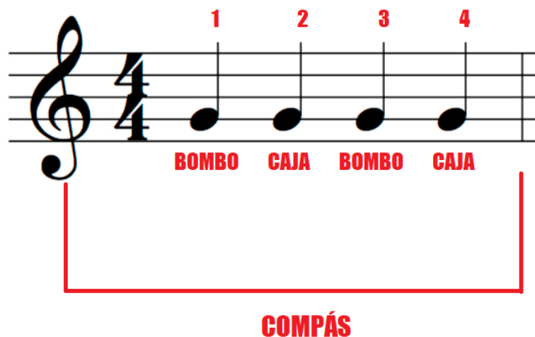
Figura 4: Compás compuesto por cuatro tiempos, donde se indica dónde suena el bombo y la caja en una base de rap normal. [Elaboración propia].

el rap, casi siempre hay cuatro tiempos, la caja suena en el segundo y cuarto tiempo, y el bombo en el primero y tercer tiempo), de esta forma, los raperos no pierden el hilo conductor de la base, y saben en qué momento termina el compás (un compás se denomina al conjunto de tiempo que hay, por ejemplo, si nosotros tenemos una base de rap, un compás equivaldrá a cuatro tiempos, véase figura 4).