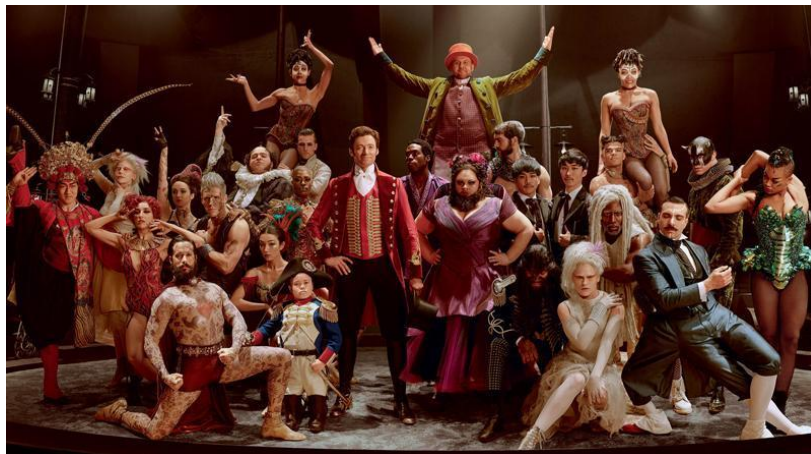
Figura 1: Fotografía donde se puede apreciar las diversas facetas y características de los personajes en The Greatest Showman . Extraído de “Crítica de El gran showman con un entregado Hugh Jackman”. Hobbyconsolas. https://www.hobbyconsolas.com/reviews/critica-gran-showman-entregado-hugh-jackman-182198

Comenzaremos por The Greatest Showman , la canción analizada será The Greatest Show (Benj Pasek, Ryan Lewis y Justin Paul, producido por Greg Wells, 2017). Esta canción es, por así decirlo, la cúspide de todo el largometraje. Para ponerlos un poco en contexto, partimos de la base de que nuestro protagonista Phineas Taylor Barnum, necesita acompañantes para que le sigan a hacer del circo un lugar de éxito, donde la diversión no tiene límites y donde nada importa. Es ahí cuando consigue dar con personas cuyas cualidades físicas son muy peculiares, como una mujer con barba, un enano, un hombre gigante, una albina... (véase figura 1).