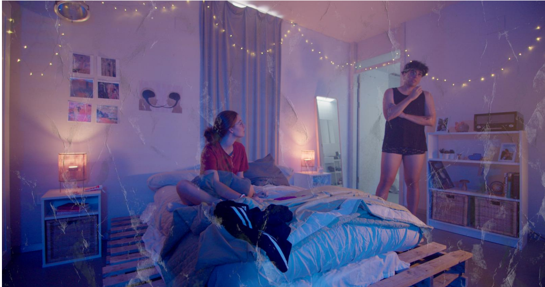
Figura 14: Ejemplo de Mixed Media, escaneamos un papel arrugado para colocarlo como texturizado de la escena de la historia de Bloqueo , esto es simplemente una pequeña prueba de la idea que tuvimos en un inicio. [Elaboración propia].

problemas) este efecto desaparecerá. Este efecto, también ayuda a dar textura a las escenas, haciéndolas más atractivas para el ojo humano (véase figura 14).